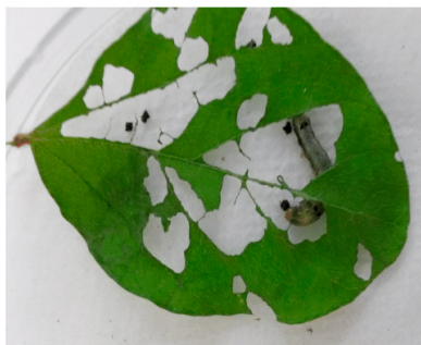
Figura 4: Consumo de oruga L3 con aplicación a las 24 horas.