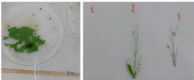
Figura 5: Comparación del nivel de consumo entre orugas L3 con aplicación (izquierda) y L4 sin aplicación (derecha) 72 horas DDA, lo cual tuvo mayor consumo las orugas L4.