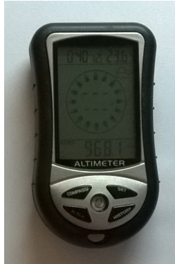
Figura 1. Altimetro barométrico utilizado nas avaliações.