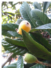
Figura 1 - Nêspera.

Nêspera ( Eriobotrya japonica Lindl.) é uma fruta, ilustrada na Figura 1 com potencial antimicrobiano alcançado principalmente pelo ácido ursólico (Rashed e Butnariu, 2014; Bobis et al. , 2015; Wozniak et al. , 2015).