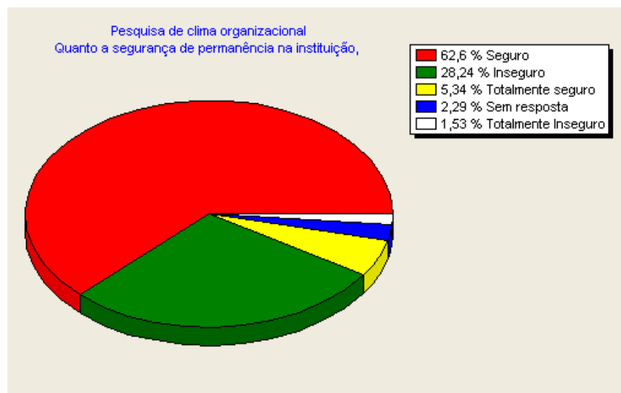
Gráfico 4 – Segurança de permanência na instituição.