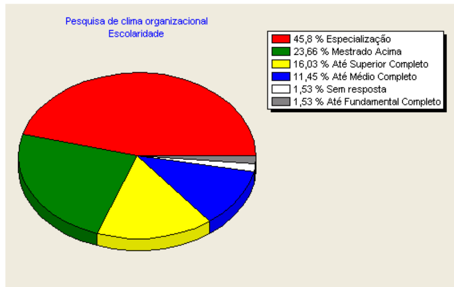
Gráfico 1 – Nível de escolaridade.

O nível de escolaridade dos respondentes da pesquisa está representado no gráfico 1. Os dados evidenciam que o questionário foi majoritariamente respondido por profissionais com pós-graduação.