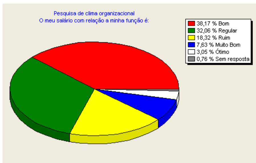
Gráfico 2 – Salário em relação à função.

Outro tema abordado disse respeito à remuneração. O gráfico 2 apresenta os resultados sobre a questão que indagou pela relação entre o salário recebido e a função exercida.