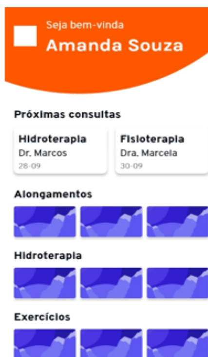
Figura 2 – Protótipo de tela

As Figuras 2 e 3 ilustram os protótipos de tela do aplicativo.