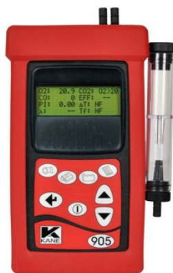
Figura 1. Analisador de gases KANE modelo 905 (INSTRUTEMP, 2020).

No estudo da eficiência de combustão foram adotados os seguintes emissores como parâmetros de estudo: CO, NO e a temperatura. Este estudo consistiu na realização de medições em um ponto de amostragem localizado numa chaminé de uma caldeira que utiliza lenha como combustível. Para isso foi utilizado um analisador de gases da marca KANE modelo 905. O aparelho em questão pode ser visto na Figura 1.