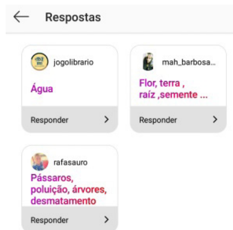
Figura 1: Pesquisa com seguidores do Instagram

Na primeira fase, os participantes responderam à pergunta “Quais palavras não podem faltar no Librário do Meio Ambiente”. Não existiu um número mínimo ou máximo de caracteres, poderiam responder da forma que julgassem mais adequadas.