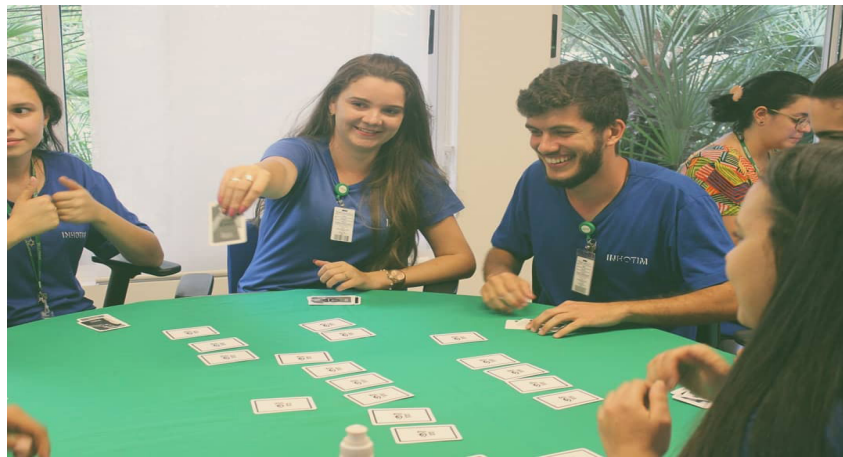
Figura 5: Oficina do jogo Librário do Meio Ambiente

Para aplicação do protótipo do Librário do Meio Ambiente em oficina (de teste) foi preciso à impressão de dois jogos. A oficina foi realizada na Escola de Design - UEMG, por razões práticas. As respostas dos participantes e a experiência prática da oficina serviram de material para análise primária do protótipo (Figura 5).