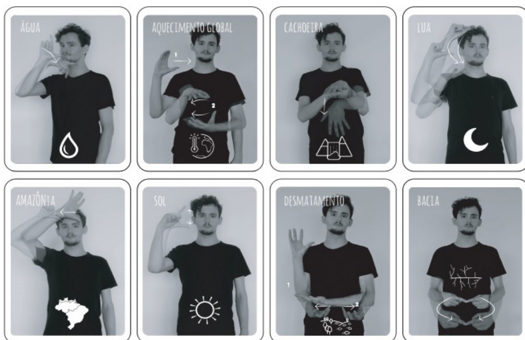
Figura 4: Cartas do jogo Librário do Meio Ambiente

Foram selecionadas as palavras que teriam maior possibilidade de se adequarem ao formato do jogo (carta composta de foto + ícone + seta + palavra em português) visando facilitar o entendimento do usuário. A partir das palavras selecionadas, programou-se, com modelo fotográfico, a realização de sessão de fotos dos sinais. As fotos foram editadas, conforme estilo característico dos jogos Librário já existentes. Assim, todas as imagens na cor preta e branca, e o enquadramento de forma que os braços, mãos e rosto possam ser visualizados. Além disso, os sinais com movimentos foram representados por “fantasmas” (imagens sobrepostas) dos braços e mãos conforme imagem (Figura 4).