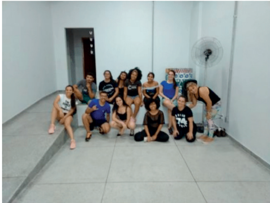
Figura 2. Turma adolescente/adulto (acima de 14 anos)

Na primeira aula referente aos indivíduos acima de 14 anos, houve uma certa quantidade de homens interessados em participar; no entanto, a participação do sexo feminino foi predominante. Expressado em valores, cerca de 90% das participantes eram mulheres e apenas 10% eram homens. Para essa turma, os ritmos musicais mais trabalhados com essa turma foram axé-funk, com coreografias de maior expressão corporal e complexidade.