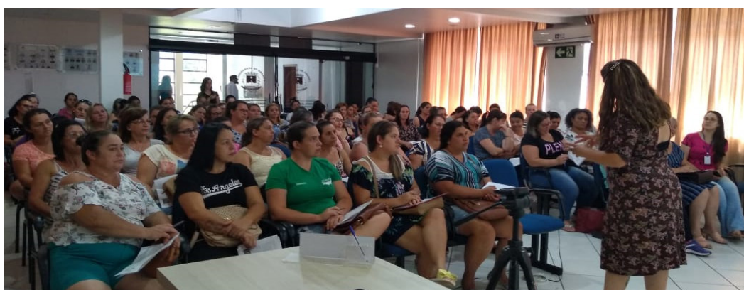
Figura 1. Registro fotográfico do 5º Seminário da Qualidade da Alimentação Escolar de Francisco Beltrão. Fevereiro de 2019.

A partir dos dados obtidos com a aplicação dos questionários, foram elaborados os Manuais de Boas Práticas de Manipulação e Procedimentos Operacionais Padrão e vem sendo entregues e aplicados nas unidades escolares. Simultaneamente, já foram realizados 6 Seminários anuais sobre a Qualidade da Alimentação Escolar de Francisco Beltrão, com a sexta edição em fevereiro de 2020, realizado em parceria com o Setor de Alimentação da Secretaria de Educação do município, contando com a participação média de cem cozinheiras em cada edição dos Seminários (Figuras 1 e 2).