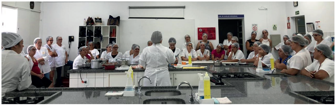
Figura 2. Registro fotográfico da oficina prática do 6º Seminário da Qualidade da Alimentação Escolar de Francisco Beltrão. Fevereiro de 2020.