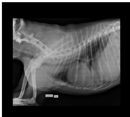
Imagem 2: Radiografia do tórax em projeção lateral.