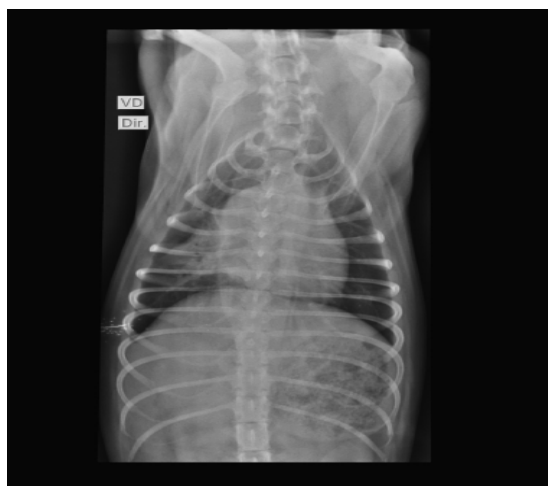
Imagem 1: Radiografia de tórax em projeção ventro-dorsal.