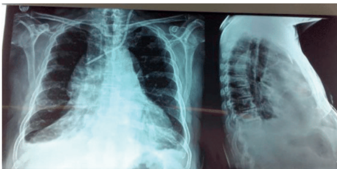
Figura 1. Radiografia de tórax inicial