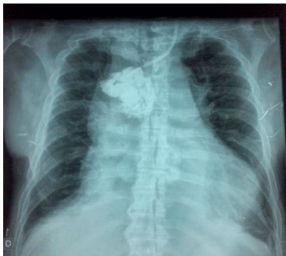
Figura 2. Radiografia de tórax com contraste pelo cateter hd