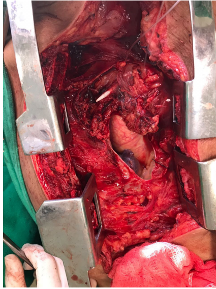
Figura 3. Esternotomia com evidência de lesão venosa