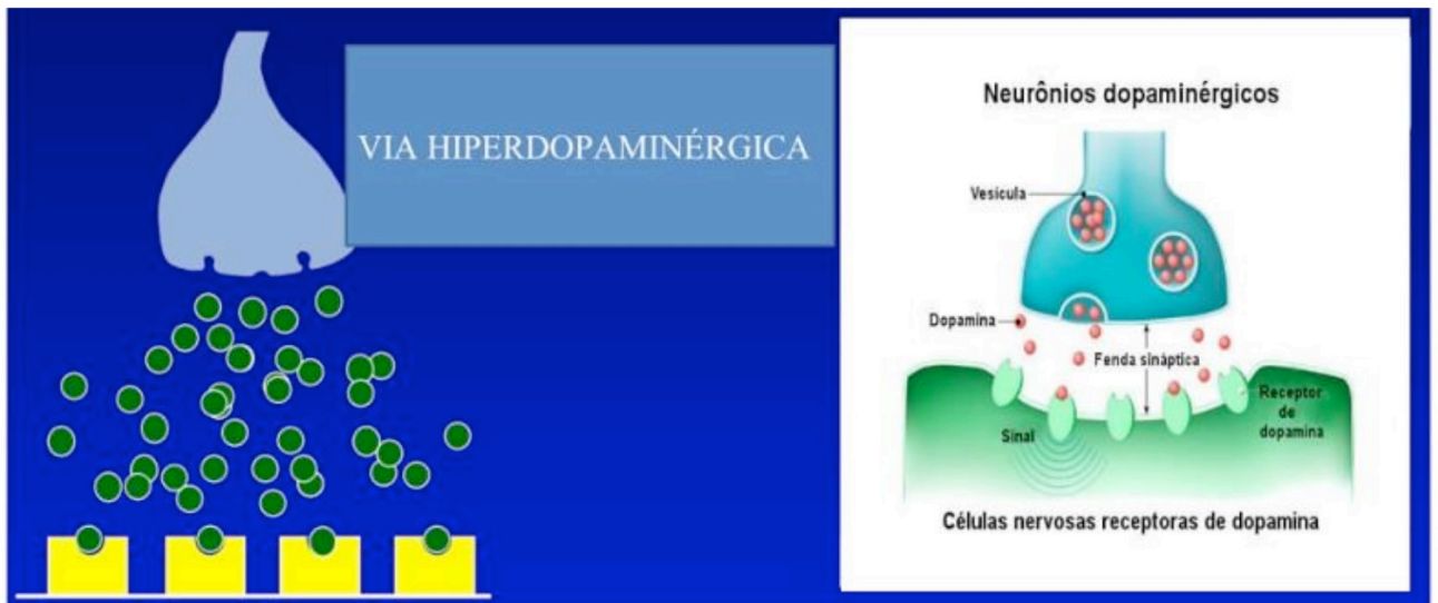
Figura 2. Teoria Dopaminérgica da esquizofrenia

De acordo com o Ministério da saúde em seu protocolo clínico e diretrizes terapêutica demonstra uma melhora no quadro clínico do paciente, pelo uso dos antipsicóticos. Recomenda-se preferencialmente a monoterapia para o início de tratamento. Dentro dessa classe de medicação, os mais utilizados na terapia são a Olanzaprina, Risperidona, Ziprasidona, Clozapina, Clorpromazina e Quetiapina.