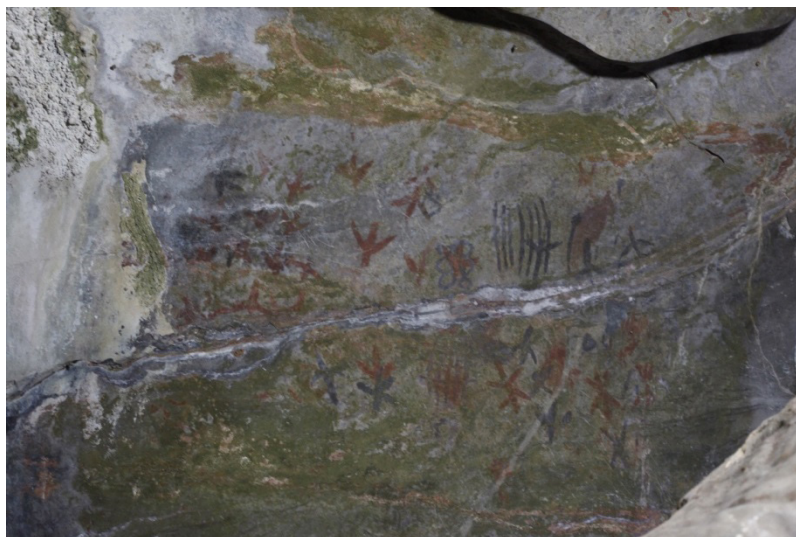
Figura 04- Pinturas registradas em São Desiderio.