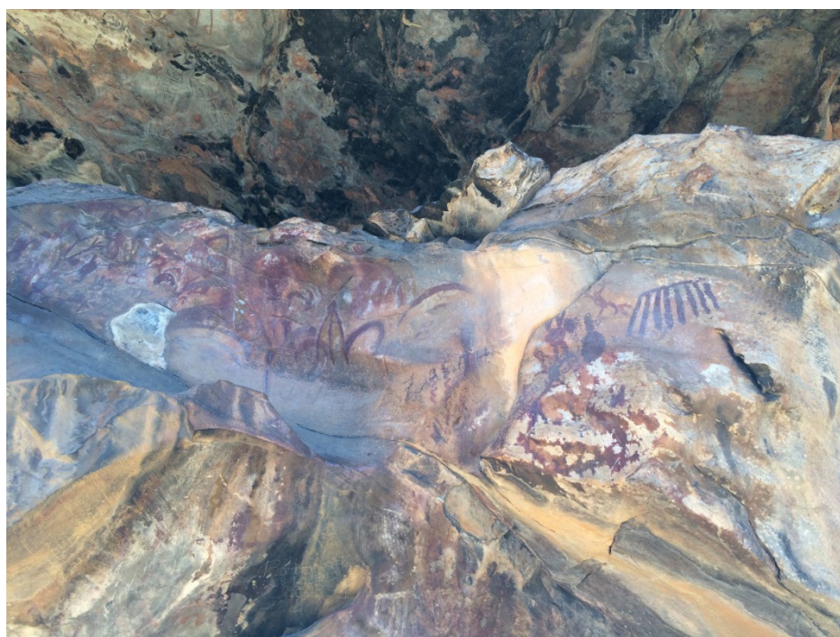
Figura 05- Pinturas registradas em São Desiderio.

Apesar de haver certa proximidade territorial com São Raimundo Nonato, as inscrições diferem quanto ao grafismo, cores e temáticas. As imagens encontradas em São Desidério segundo a professora e arqueóloga Maria Beltrão, estão associadas a eventos celestes vinculando-os tematicamente àquilo que chamou de “Tradição astronômica” (Beltrão, 2000). Enquanto que na Serra da Capivara há predominância de animais e até pessoas.