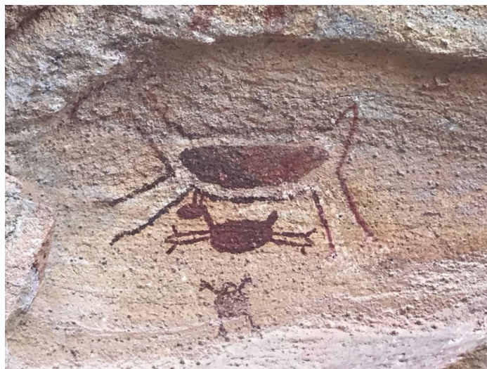
Figura 02- Representação da fauna existente.

Na arte rupestre encontrada no Parque Nacional Serra da Capivara, sobressaem às representações de animais, sendo possível reconhecer espécies inexistentes hoje na região e outras totalmente extintas, como as preguiças gigantes e os tigres dente de sabre, que faziam parte da megafauna (vivos durante o período do Pleistoceno). Existem também reproduções de capivaras, veados galheiros, caranguejos, jacarés e certas espécies de peixes (Figura 02).