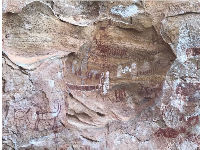
Figura 03- Representações humanoides e da fauna.

Houve na região duas tradições, Nordeste e Agreste. A primeira apresenta um estilo inicial, Serra da Capivara, cuja característica é a eclosão do movimento, do dinamismo e da encenação esfuziante de alegria. O estilo final, Serra Branca, se caracteriza pelos componentes ornamentais, as vestimentas e os cocares, que resulta em uma decoração gráfica muito particular que persiste e que contrasta com as características do estilo inicial (GUIDON,1989).