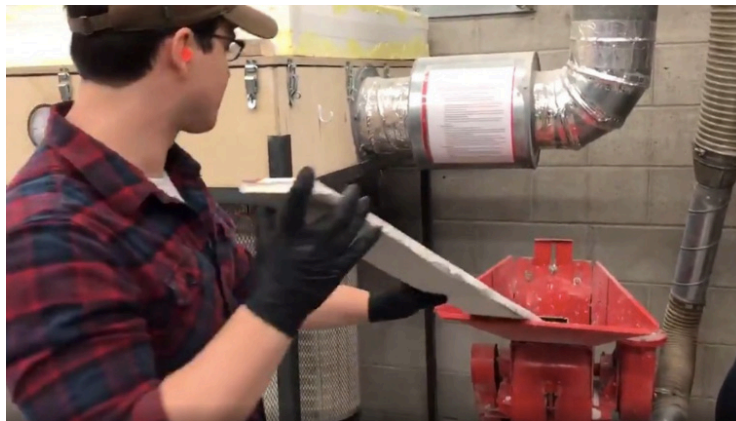
Figura 4. Máquina de fragmentação