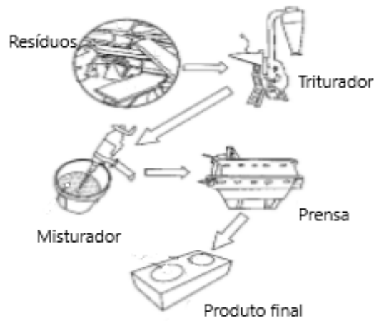
Figura 1. Descrição geral da metodologia

Fonte: Baseado no desenho original da patente IPN WO2020/014455 A1