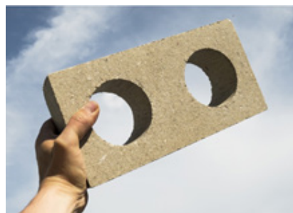
Figura 2. Bloco prensado com núcleo oco

Elementos de alvenaria com núcleos ocos (figura 2) funcionam como bons isolantes térmicos, facilitam a passagem de instalações elétricas ou hidráulicas, podem funcionar como moldes para concretar vergas ou vigas, e são mais leves que os elementos tradicionais de alvenaria sólida, reduzindo os custos gerais de construção.