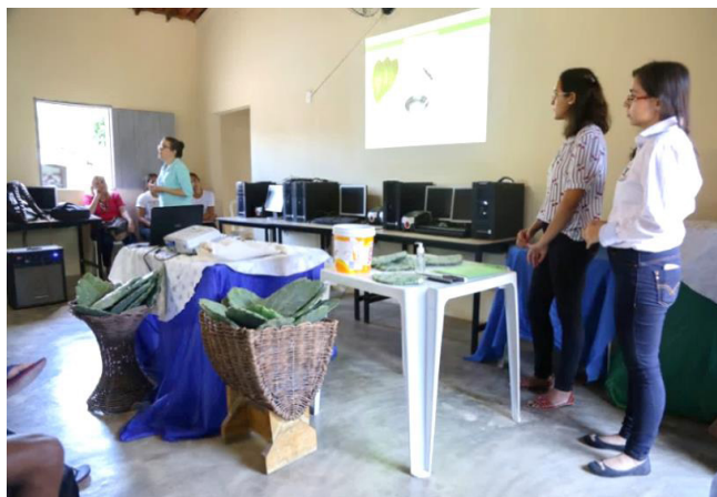
Figura 2 - Apresentação de uma oficina durante o encontro do Grupo Focal da comunidade