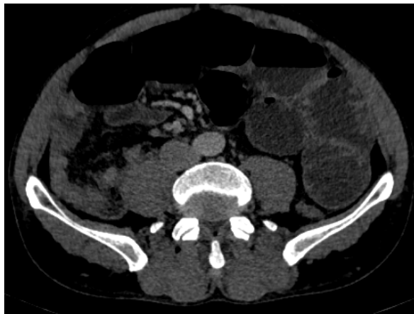
Figura 2. Tomografia computadorizada de abdome, evidenciando distensão difusa de alças intestinais delgadas e cólicas, com nível hidroaéreo.

Optamos por realizar uma tomografia computadorizada de abdome com contraste, evidenciando distensão difusa de alças intestinais delgadas e cólicas, com nível hidroaéreo a esclarecer (figura 2). Paciente foi submetido a uma laparotomia exploradora, no qual foi evidenciado diverticulite de Meckel com distensão de alças do intestino delgado proximal ao divertículo (figura 3).