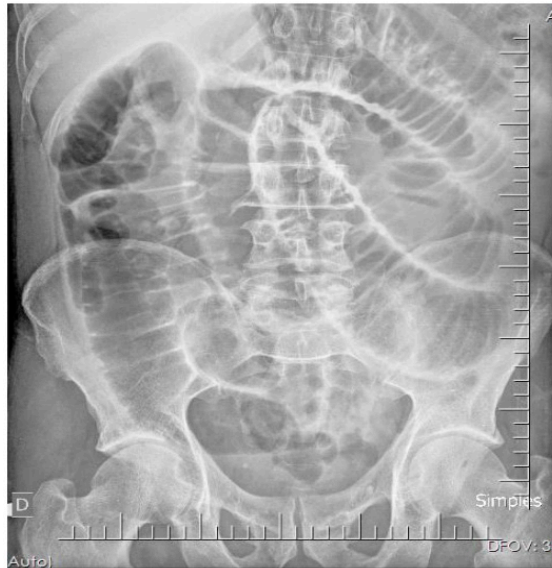
Figura 1. Radiografia de abdome agudo evidenciando distensão de alças, nível hidroaéreo.

Optamos por realizar uma tomografia computadorizada de abdome com contraste, evidenciando distensão difusa de alças intestinais delgadas e cólicas, com nível hidroaéreo a esclarecer (figura 2). Paciente foi submetido a uma laparotomia exploradora, no qual foi evidenciado diverticulite de Meckel com distensão de alças do intestino delgado proximal ao divertículo (figura 3).