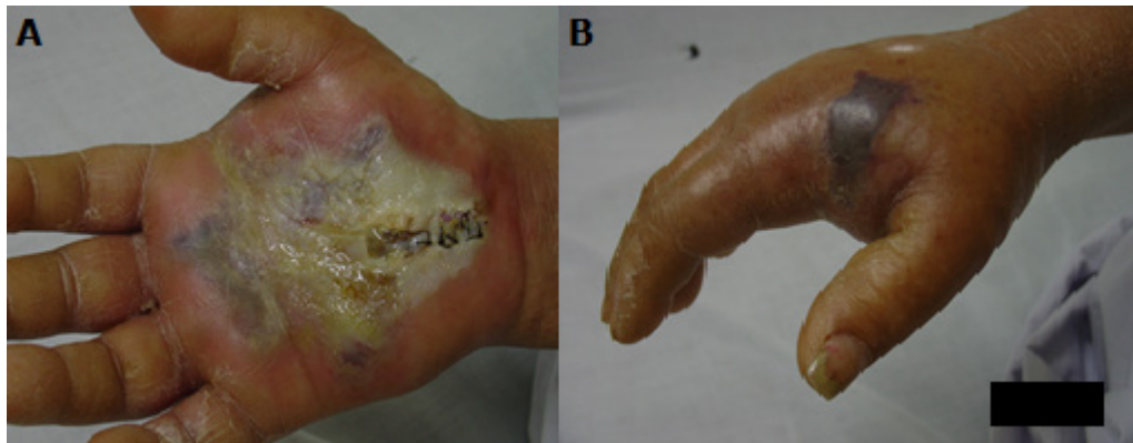
Figura 2. Infecção de ferida operatória de liberação do retináculo dos flexores. A- palma da mão. B – região lateral da mão.

Evoluiu com infecção, edema e temporária perda da flexibilidade dos dedos (figura 2), alguns dias após alta hospitalar.