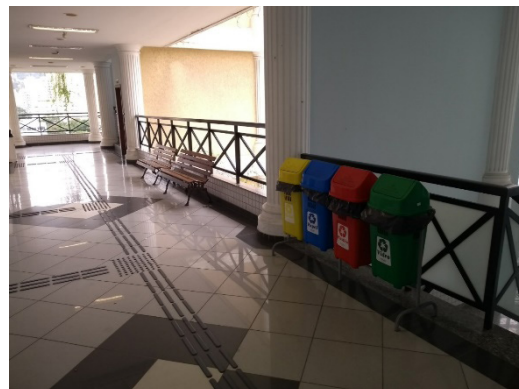
Coletores de água da chuva e coleta seletiva

Passou-se a utilizar dois geradores com potências de 456 e 230 kVA. Esses geradores funcionam a diesel e são acionados automaticamente e diariamente das