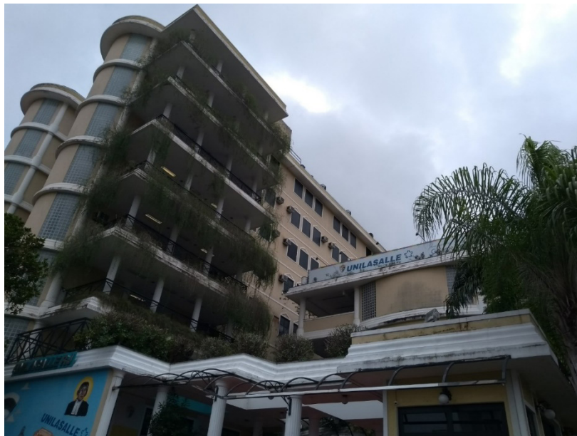
Unilasalle-RJ em Niterói