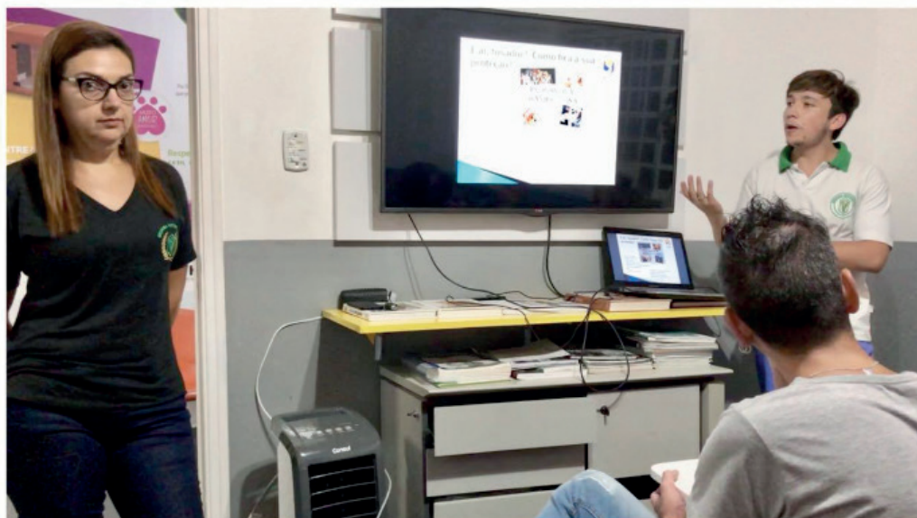
Figura 1. Palestra ministrada por graduandos da universidade aos tosadores e banhistas da escola parceira.