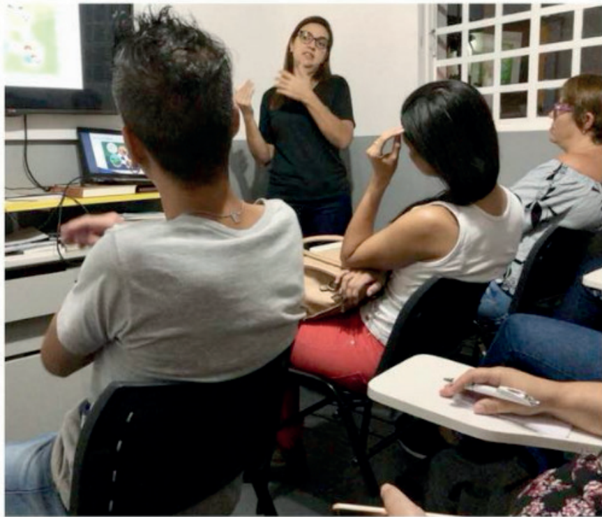
Figura 2. Palestra ministrada por graduandos da universidade aos tosadores e banhistas da escola parceira.