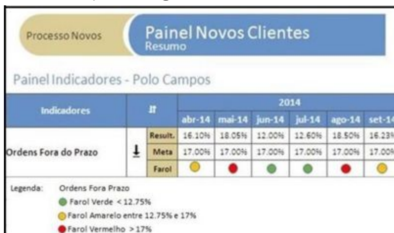
FIGURA 9 – Resultados de 2014 sem a implantação do GDR

Os resultados obtidos entre o período de Abril a Setembro de 2014 sem a implantação do GDR é exposto na figura 9.