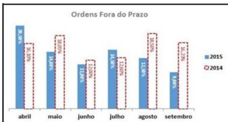
FIGURA 10 - Gráfico da análise comparativa para o indicador Ordens Fora do Prazo.

Os resultados obtidos no período analisado em 2015 foram comparados com o mesmo período em 2014, conforme apresentado na figura 10. Portanto, é possível constatar que a implantação do GDR proporcionou resultados significativos a partir de Maio de 2015 em relação ao mesmo período de 2014, com exceção do mês de Julho.