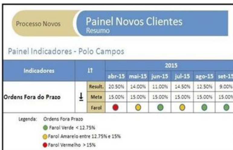
FIGURA 7 - Painel com os resultados alcançados frente às metas de ordens fora do prazo no período analisado para a aplicação da metodologia.

observadas anteriormente. Contudo, nos meses de Agosto e Setembro as metas foram alcançadas com êxito (farol verde).