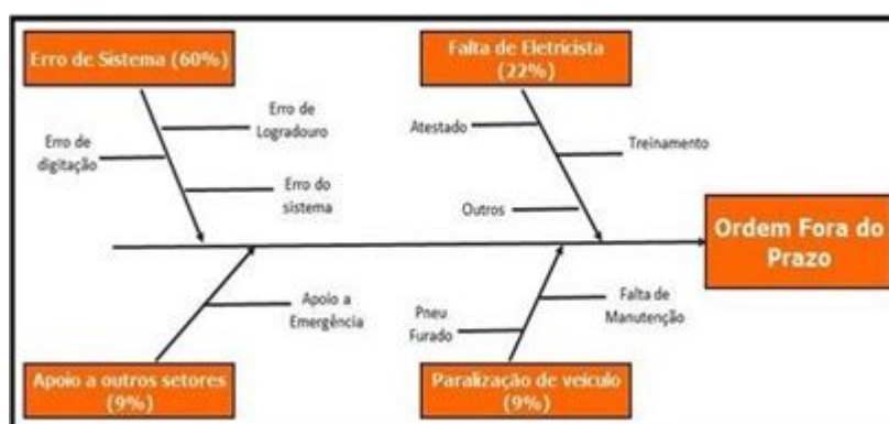
FIGURA 5 - Aplicação do Diagrama de Ishikawa para ordens fora do prazo.

Uma análise mais detalhada das principais causas de cada problema é apresentada com o Diagrama de Ishikawa na figura 5. Constatou-se que as causas fundamentais foram “Erro de Logradouro” (erro no cadastro do logradouro do cliente quando houve a solicitação do pedido); “Erro de digitação” (os eletricitistas respondem as ordens de serviços que foram fazer através de aparelhos eletrônicos, que são chamados de coletores, conectados ao sistema da empresa) e; “Erro do sistema”, falha do sistema de suporte da empresa.