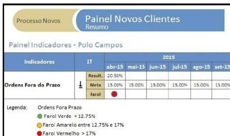
FIGURA 2 - Painel de indicadores

Com o intuito de armazenar os dados coletados, foi elaborada uma planilha para compilar todas as anomalias decorrentes das operações realizadas diariamente no campo, como mostra a figura 3.