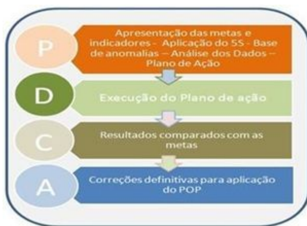
FIGURA 1 - Modelo do planejamento a partir do ciclo PDCA

O processo de implantação do gerenciamento da rotina teve seu início a partir de uma apresentação fundamentada no ciclo PDCA, conforme a figura 1, e o programa 5S, que almejou auxiliar na conscientização dos colaboradores para o cumprimento dos padrões.