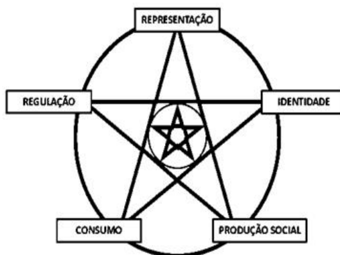
Figura – Circuito da Cultura Universitária

Mas, para que o “circuito da cultura” fosse utilizado como elemento constitutivo da cultura universitária, precisou ser reelaborado como demonstra a figura a seguir.