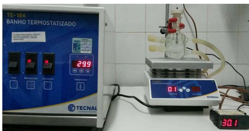
Figura 1 – Unidade Experimental.

A unidade experimental utilizada na realização dos experimentos é apresentada na Figura 1. Ela é constituída de uma célula de vidro borossilicato encamisada com capacidade de 50 mL, banho termostatizado (TECNAL, TE-184), termopar (FullGauge, TIC-17RGTi) inserido em uma rolha de tecnyl, usada para a vedação da mesma na entrada da célula, já que foram utilizados solventes voláteis, agitador eletromagnético (TECNAL, TE-0851) e uma barra magnética (1,512 cm de comprimento e 0,607 cm de diâmetro) revestida com teflon.