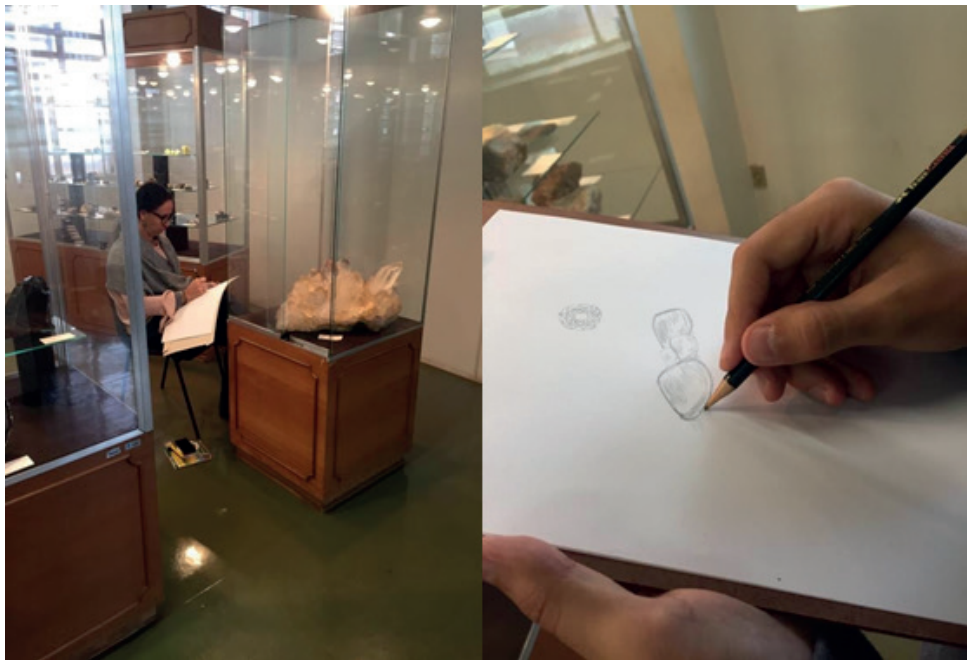
Figura 1 - Oficina de Desenho de Observação de Rochas