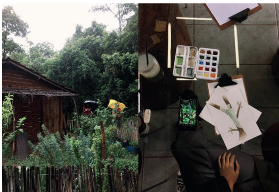
Figura 4 - Oficina de Ilustração Botânica