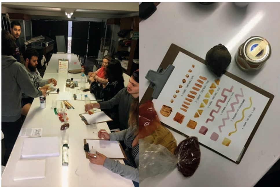
Figura 2 - Oficina de Grafismos Indígenas e Pigmentos Naturais