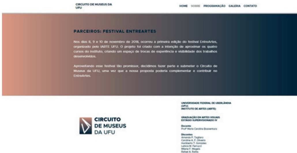
Figura 5 - Website do Circuito de Museus da UFU