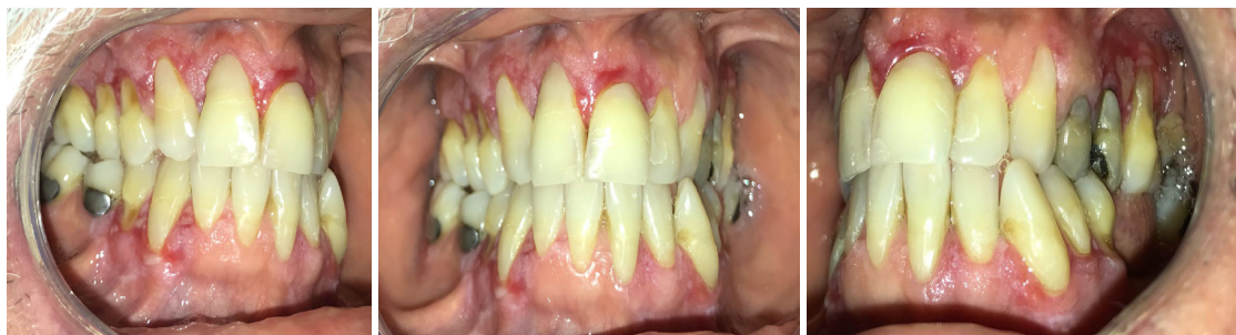
Figuras 1.1, 1.2 e 1.3: Aparência clínica das arcadas dentárias superior e inferior do paciente, pelas vistas lateral direita, central e lateral esquerda.

A primeira hipótese levantada foi a possibilidade de doença periodontal induzida por placa, pela observação de recessão gengival avançada, todavia sem presença de bolsas, porém demonstrando perda de inserção com a quantidade de biofilme que não justificaria tamanha reação inflamatória. A segunda hipótese foi de que seria uma doença causada por fungo, pois o paciente era trabalhador rural. Dessa forma, foi feita a prescrição de antifúngicos e se observou discreta melhora sem, contudo, erradicação do quadro inflamatório. Após refutação dessas hipóteses a possibilidade do diagnóstico de Líquen Plano era muito plausível porém, detectável apenas após confirmação com exame histopatológico e, assim foi feito. A biopsia incisiva executada e sua devida análise confirmou o último diagnóstico.