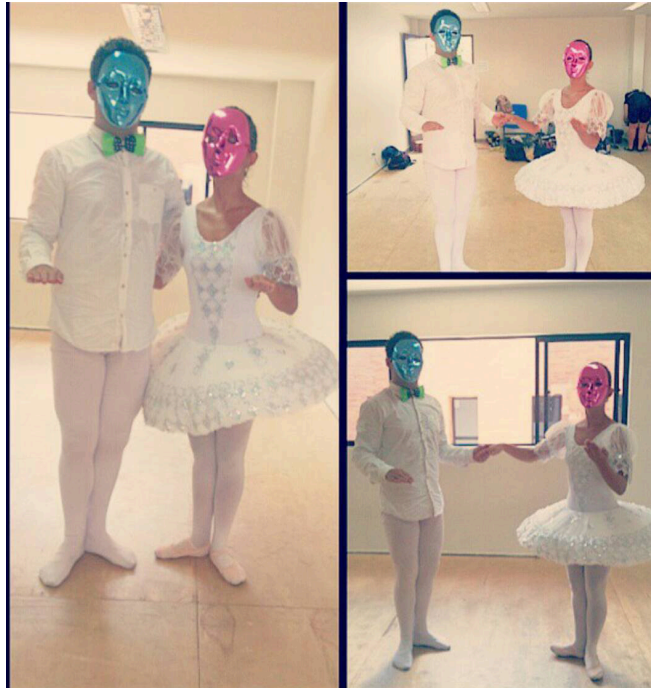
Figura 2 – O Balé Triádico reimaginado.

Se por vezes a ideia de História produz muitos nomes e datas para serem reproduzidos em uma linha temporal reta e plana, cabe ao campo de conhecimento da dança encurtar distâncias trazendo outras perspectivas em movimento para abordar relações de tempo que geram. A dança reafirma sempre sua especificidade em relação ao tempo: corpos evocando memórias expandidas em movimento, presença e espacialidade. Um dos principais fatores de caracterização da dança seriam escalas de tempo que levam em consideração a natureza do corpo. Se a dança projeta escalas que conectam movimento e ação sua feitura também relaciona corpo e ambiente.