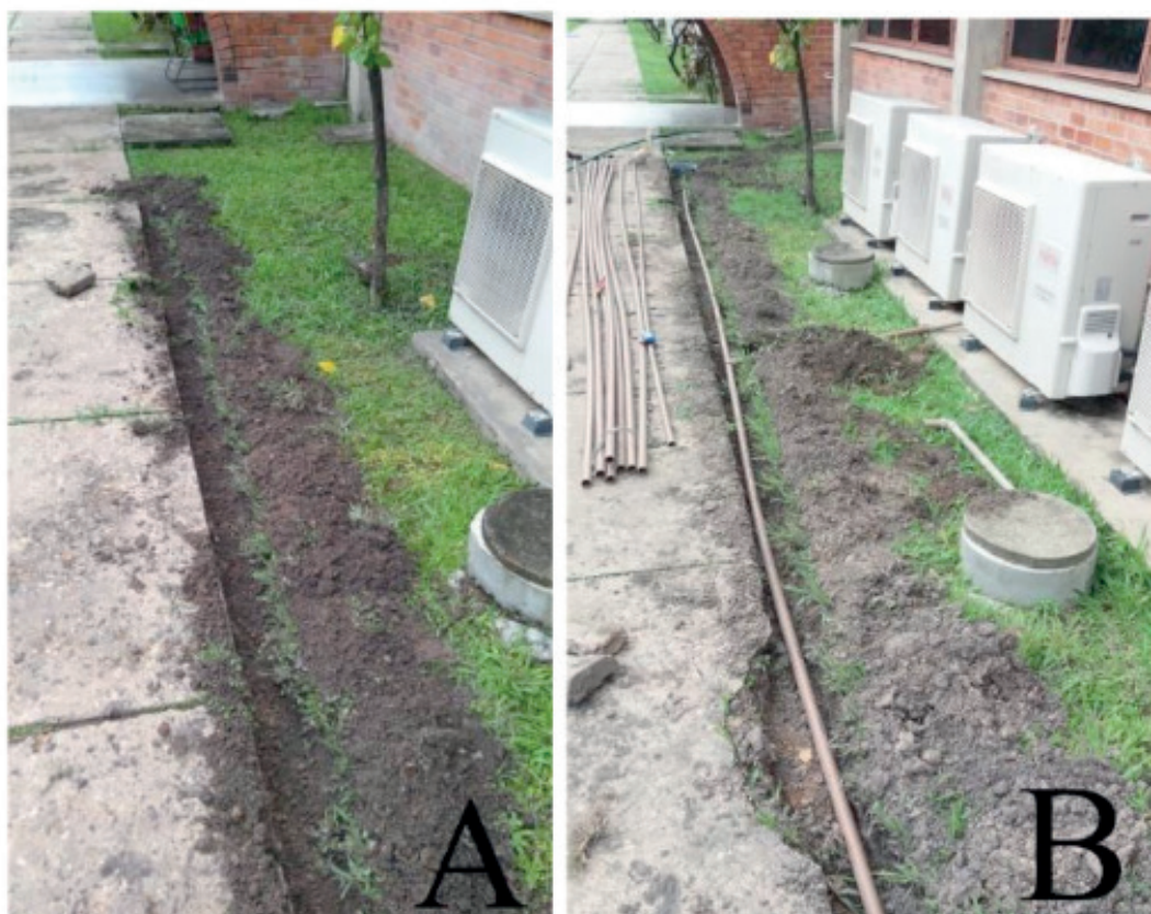
Figura 2: Escavações para passagem da tubulação (A) - Passagem dos canos (B).

Para verificar o funcionamento do sistema testes foram realizados durante a instalação, colocando-se água na tubulação e verificando a direção e velocidade de escoamento.