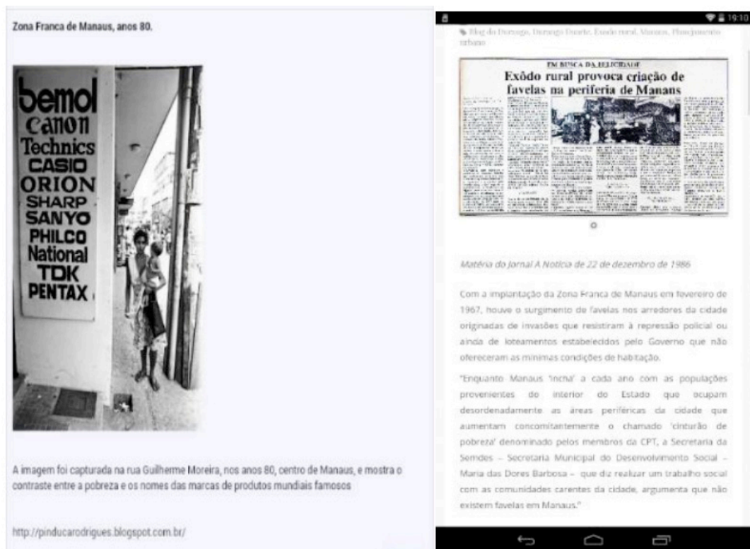
Figura 1. A Contradição entre uma moradora de rua e as grandes marcas internacionais instaladas em Manaus na década de 1980. Fonte: Blog do Pinduca. Acesso em 20/05/2019.

Ao analisar as mudanças da cidade de Manaus a partir dos anos 1980, nota-se o surgimento de uma classe média mais numerosa, o acirramento das desigualdades sociais, o crescimento vertiginoso da violência urbana, o estrangulamento da malha viária, a intensificação da sensação de insegurança, a degradação ambiental com o significativo crescimento da produção de resíduos sólidos, entre outras expressões desses desequilíbrios.