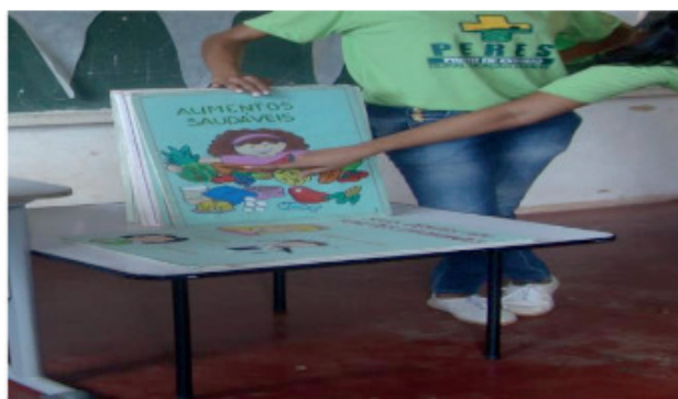
Imagem 01: PERES na comunidade-Saúde na Escola.

Saúde e a educação estão intimamente articuladas, pois são vistas como complementares e essenciais para o progresso da estratégia de saúde da família. Saúde e educação não podem ser dissociadas, caminham juntas, se articulam enquanto práticas sociais (FERNANDES, et al. 2011).