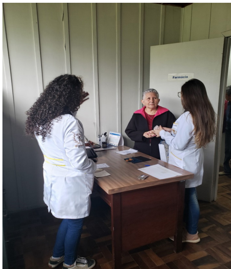
Figura 1 – Orientações sobre o Uso Racional de Medicamentos.

a devida orientação, bem como da importância do receituário médico no tocante à dispensação de medicamentos tarjados, como antimicrobianos e psicotrópicos (LIMA et al., 2017).