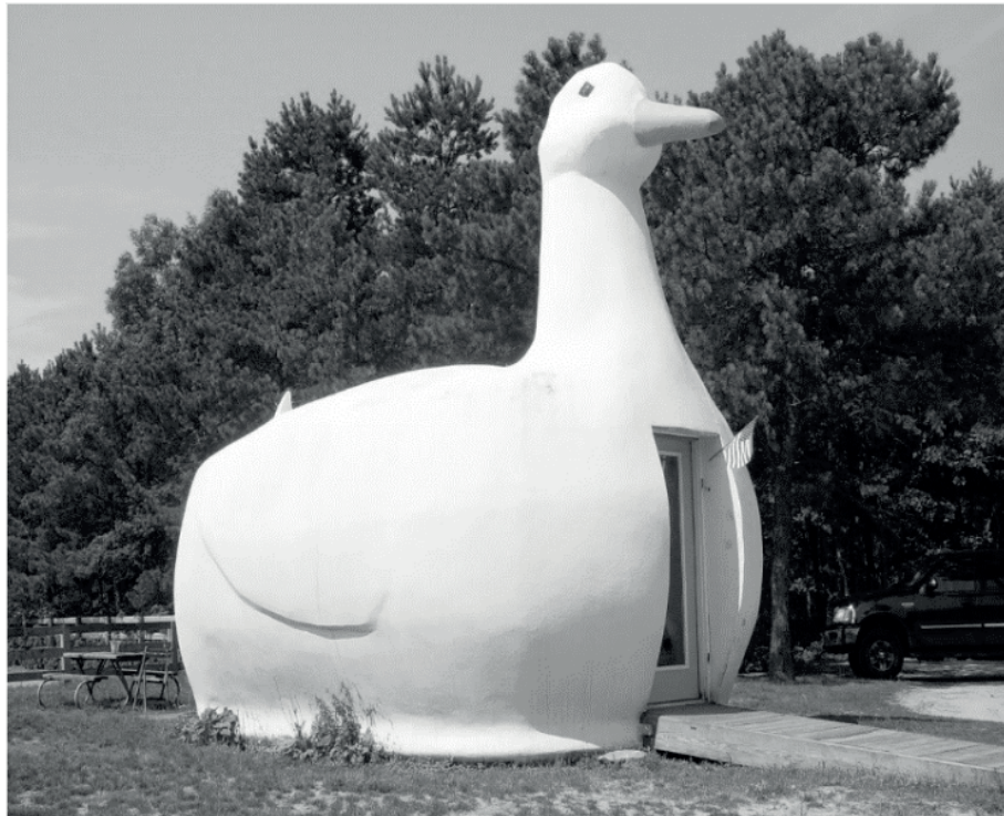
Figura 1: The Big Duck, ROBERT VENTURI.

.KOHLESTEDT, K. Lessons from Sin City: The Architecture of “Ducks” Versus “Decorated Sheds”. ArchDaily, 2016.