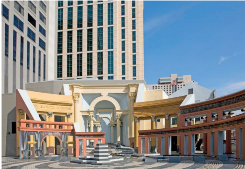
Figura 2: Piazza d'Itália, CHARLES MOORE.

diversidade de cores em tons neon na proposta do arquiteto, além de criticar os modernos com as colunas e arcos, tinha o intuito de transmitir a alegria por meio da obra, com o lema “deixa os bons tempos passarem”.