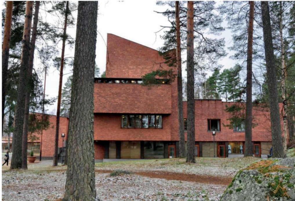
Figura 3: Câmara Municipal de Säynätsalo, ALVAR AALTO.

Nesse contexto, destaca-se como um ícone muito importante dessa vertente: Alvar Aalto. Na obra realizado pelo arquiteto, a Prefeitura de de Säynätsalo (1952). Essa edificação é composta por dois edifícios de tijolos estruturados em madeira, os quais os dois são diferenciados pela sua forma: a biblioteca é retangular e o edifício do governo em forma de U. Para Frampton, a obra consiste na resistência à dominação da tecnologia universal, além da exploração das qualidades táteis dos materiais vernaculares.