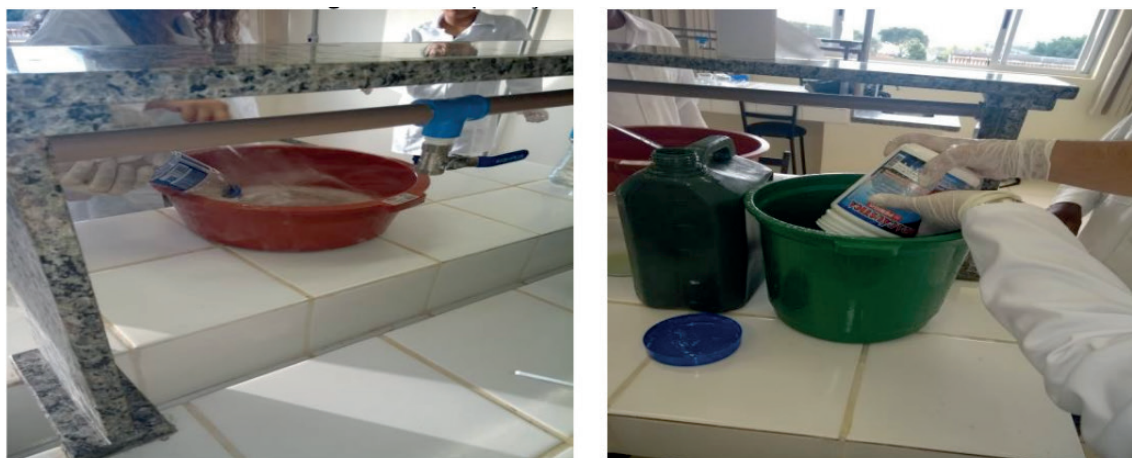
Figura 2. Preparação da mistura do sabão.