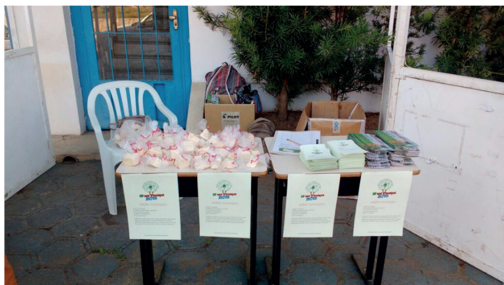
Figura 8. Estande "Sabão Ecológico".