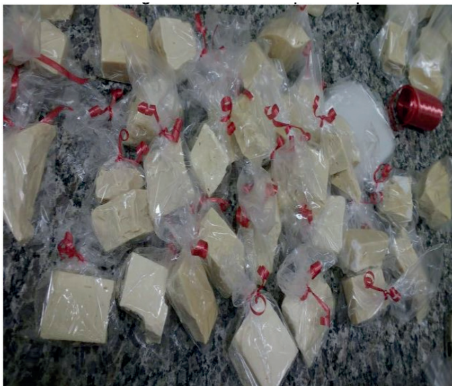
Figura 6. Sabão ecológico embalado e pronto para ser entregue.