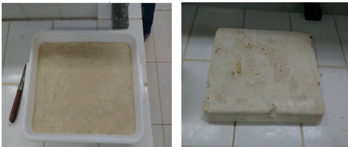
Figura 4. Sabão mais claro, depois de seco.