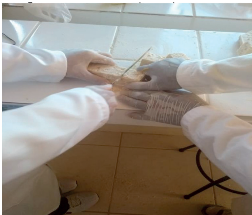
Figura 5. Sabão fatiado, pronto para embalar.