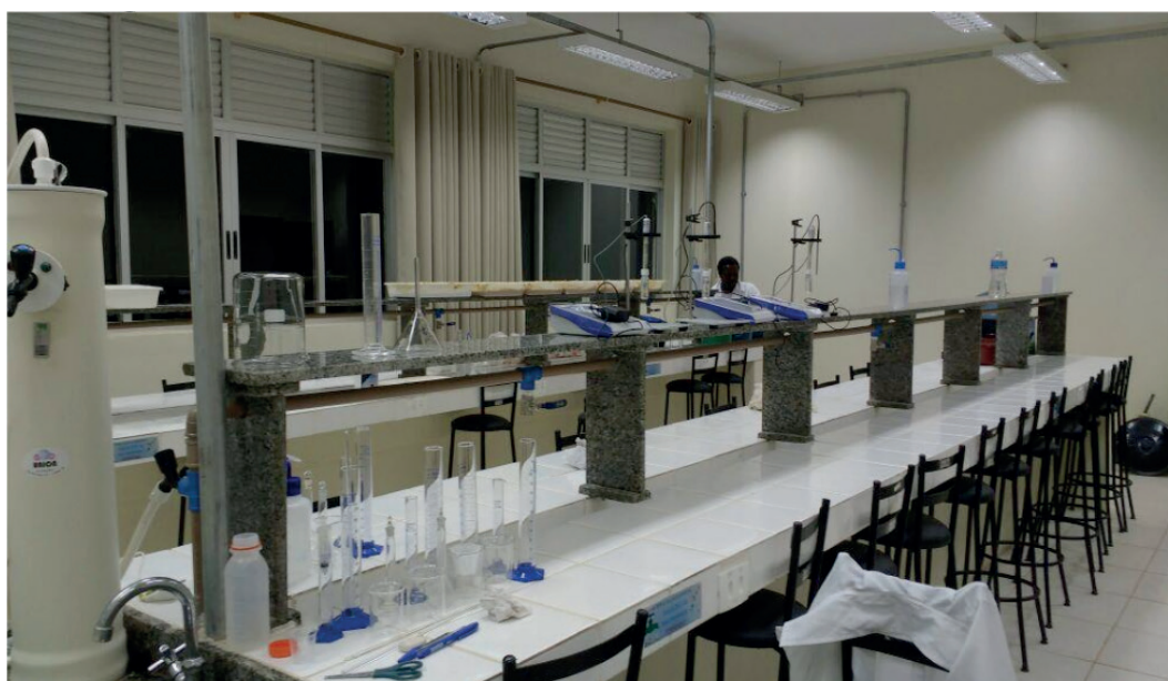
Figura 1. Foto do laboratório do IF Sudeste MG – Campus SJDR.