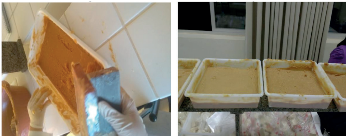
Figura 3. Mistura colocada na forma para secagem.