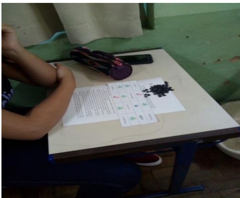
Figura 1. Jogo de bingo com os alunos.

Finalizando a prática, realizamos a aplicação de um jogo didático, no intuito de rever e exercitar os conhecimentos adquiridos, onde os alunos precisavam saber as respostas das perguntas para completar a tabela do bingo, conforme ilustrada na figura 1.