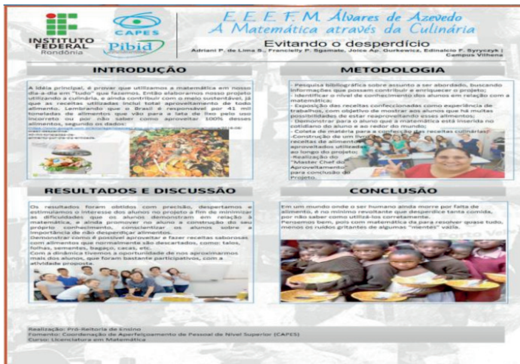
Figura 2 – Realização do Mini MasterChef e exposição do Banner

Os resultados satisfatórios contribuiu para a criação do mini livro com os conteúdos que foram abordados durante o projeto. Alguns alunos ainda possuem dificuldade em interpretar problemas que envolvam regra de três simples, frações equivalentes, e até mesmo porcentagem.