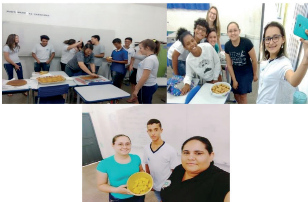
Figura 1 – Exposição das receitas com reaproveitamento de alimentos

A princípio os alunos foram divididos em grupos para tal experimento, onde cada grupo trouxe um prato preparado com total aproveitamento de alimentos, aprendendo sobre como aproveitar alimentos que normalmente jogaríamos no lixo.