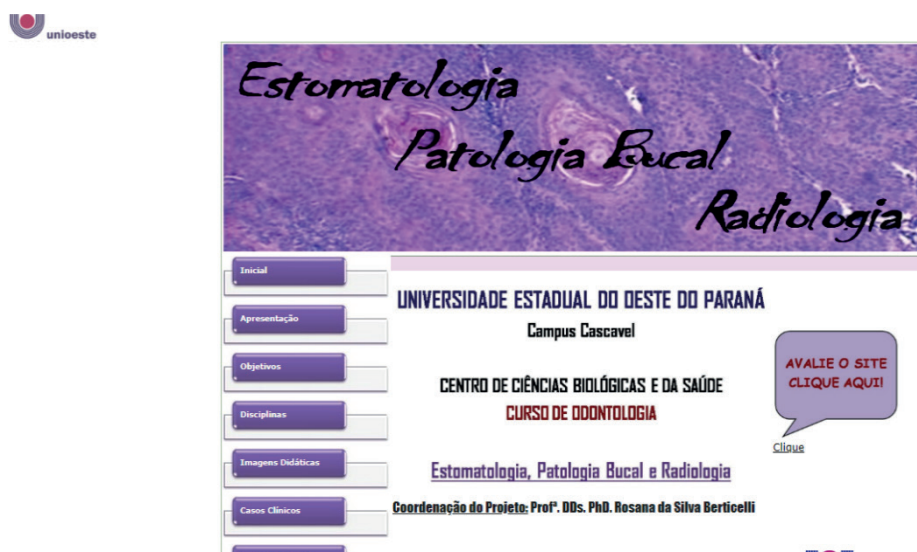
Figura 1. Imagem da página inicial do site, criado em 2008.

quanto ao conteúdo e exibição das informações. Até o presente momento, o número de acessos do site, indicado no canto superior direito, revela 8253 acessos.