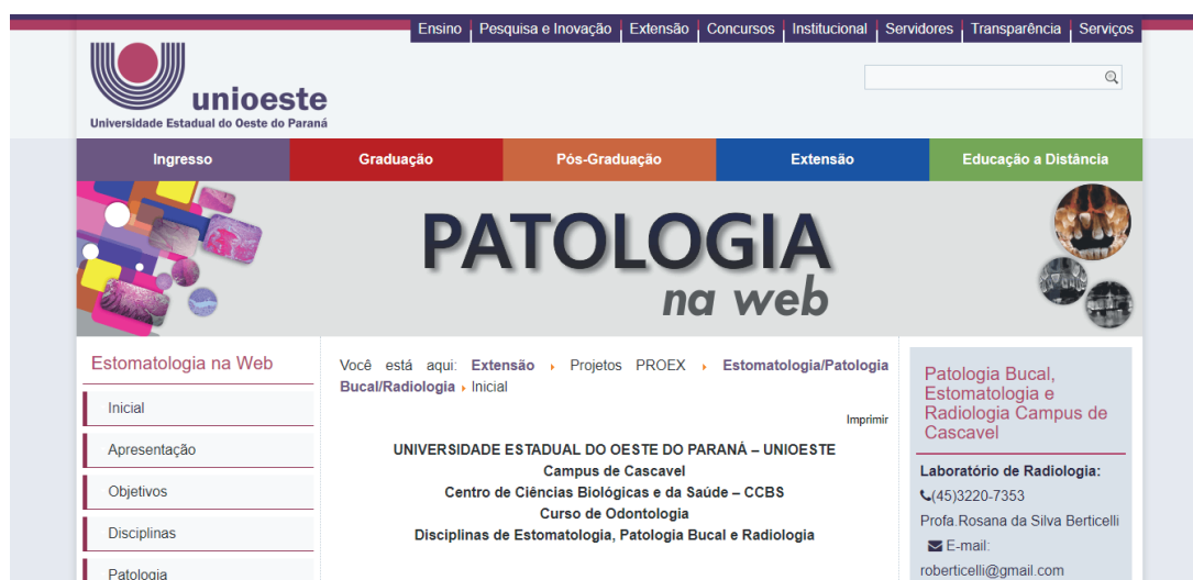
Figura 2. Imagem da página inicial do site, em processo de atualização e expansão. (2018)