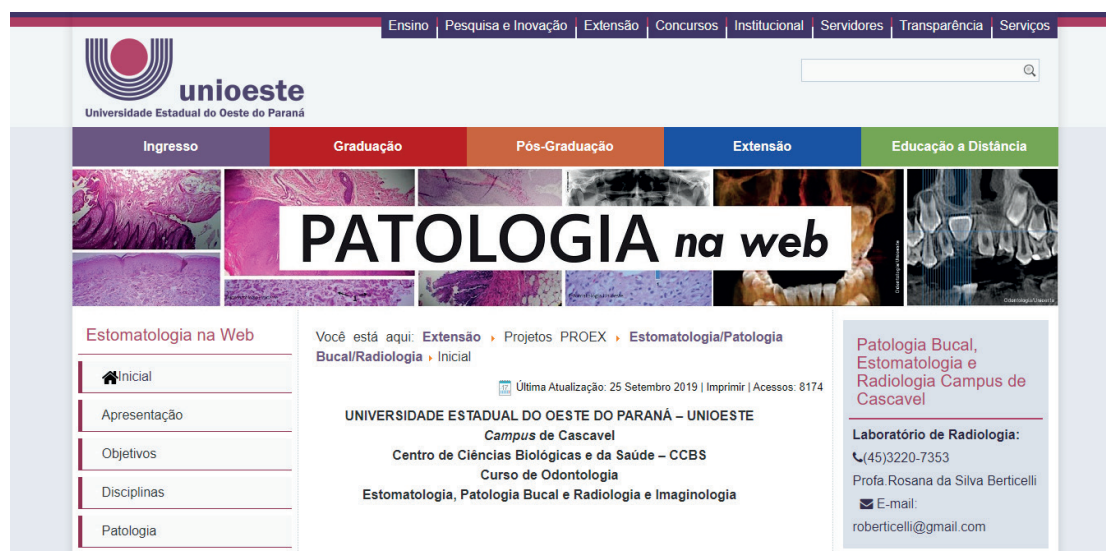
Figura 3. Imagem da página inicial do site. (2019)