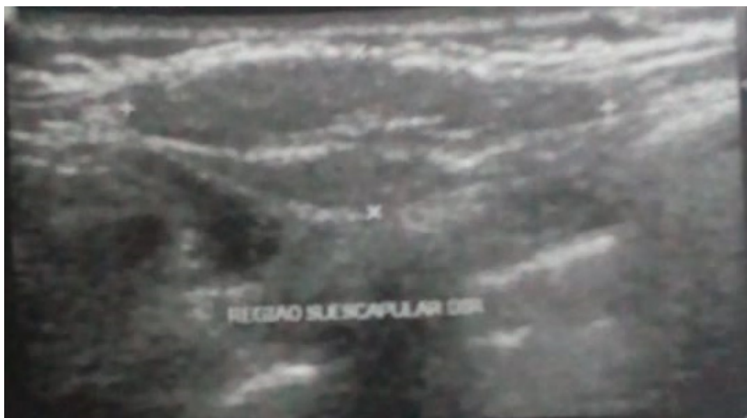
Fig 1: USG de partes moles evidenciando lesão em região subescapular.

Realiza ultrassonografia de partes moles que evidencia nódulo sólido no plano subcutâneo da região subescapular à direita, palpável, hipoeoico, de limites imprecisos e sem fluxo vascular ao doppler colorido, medindo cerca de 2,8x2,3x0,7cm, planos musculares preservados.