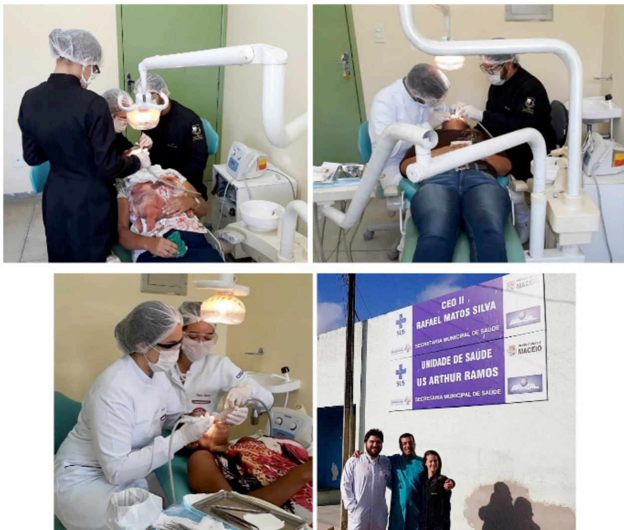
FIGURA 4: Membros da LAPECC em atendimento clínico no CEO II Rafael Matos.

Os atendimentos no CEO II Rafael Matos ocorrem semanalmente e proporciona aos membros da LAPECC uma aproximação do serviço de Periodontia especializada no Sistema Único De Saúde (SUS) (FIGURA 4).