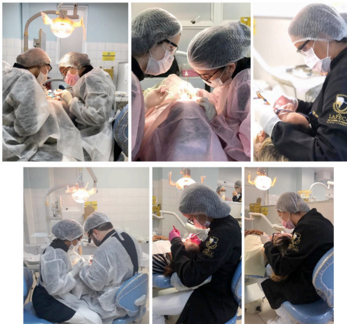
FIGURA 5: Membros da LAPECC em atendimento clínico na Clínica Escola do Cesmac.

praticar procedimentos preventivos de promoção a saúde periodontal, diagnóstico, tratamentos das doenças periodontais seja através de procedimentos básicos ou cirúrgicos e cirurgias periodontais estéticas. Neste serviço são atendidos, em média, dez pacientes a cada encontro clínico e está sendo realizado tratamento periodontal de suporte para aproximadamente 24 pacientes (FIGURA 5).