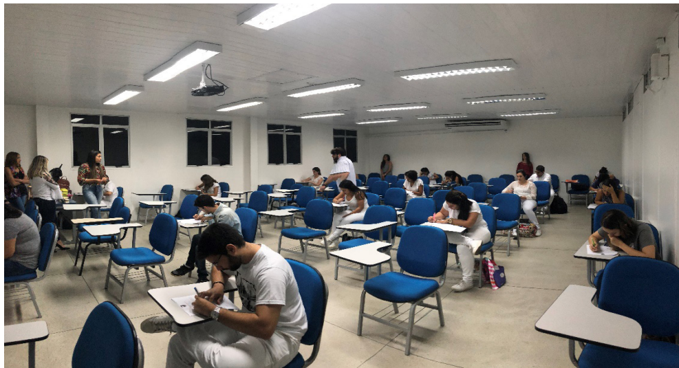
FIGURA 2: Processo seletivo da LAPECC.

Atualmente, LAPECC é formada por dezessete discentes do curso de Odontologia de diferentes universidades da cidade de Maceió e supervisionada por dois docentes do Centro Universitário Cesmact, suas atividades são desenvolvidas uma vez por semana, em um período extracurricular, não comprometendo o funcionamento da grade curricular básica da instituição e contemplam a tríade da universidade.