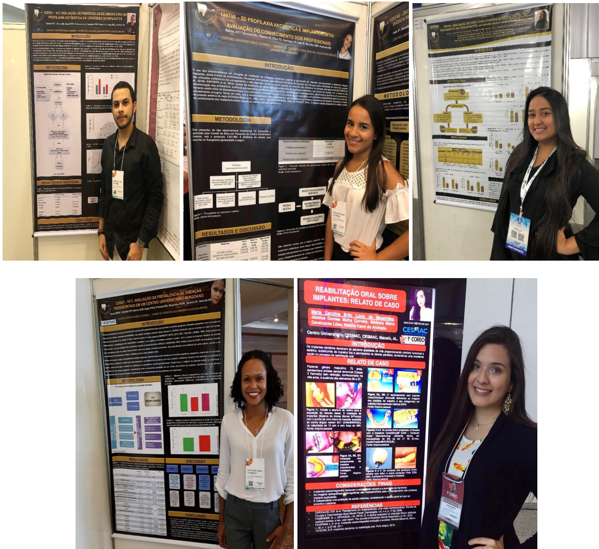
FIGURA 6: Apresentação dos trabalhos em congresso.

Na oportunidade, os membros da LAPECC participaram como congressistas e apresentaram os resultados das pesquisas desenvolvidas na liga e em um ano de atividade, cerca de quinze trabalhos foram submetidos e aprovados para apresentação em congressos de Odontologia (FIGURA 6).