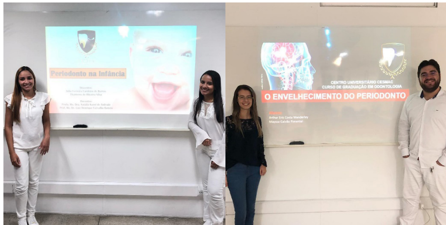
FIGURA 3: Membros da LAPECC ministrando suas aulas para os demais acadêmicos.

Os encontros teóricos acontecem, quinzenalmente, em uma sala de aula do Centro Universitário Cesmac, onde durante um ano foram ministradas doze aulas teóricas baseadas em evidências científicas e discussões sobre temas relevantes na periodontia, sendo divididas em aula expositiva e discussão de artigos científicos.