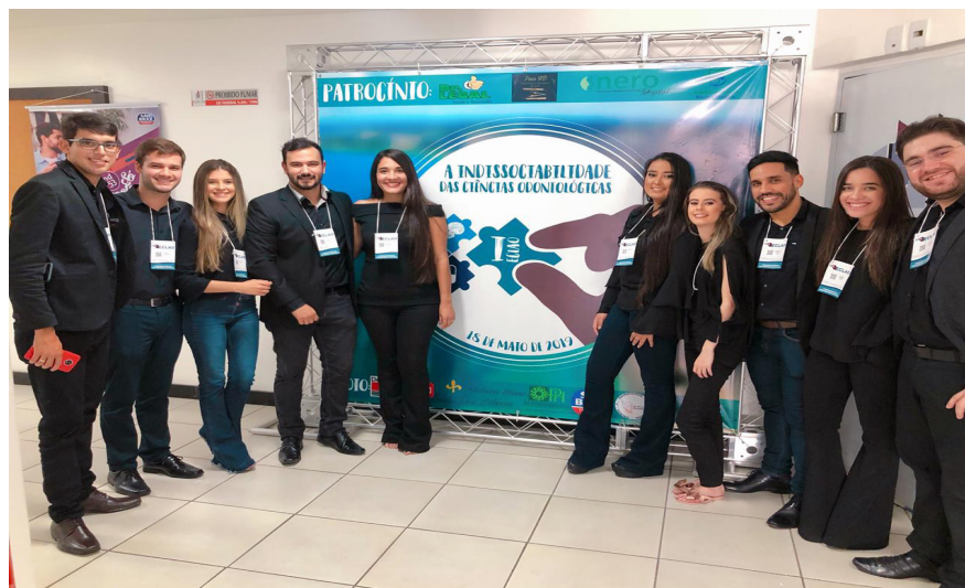
FIGURA 7: Comissão organizadora do I Encontro das Ligas Acadêmicas de Odontologia.

Na oportunidade, os acadêmicos puderam participar efetivamente da comissão organizadora, desenvolvendo atividades de logística, recepção e instalação antes, durante e depois do evento (FIGURA 7).