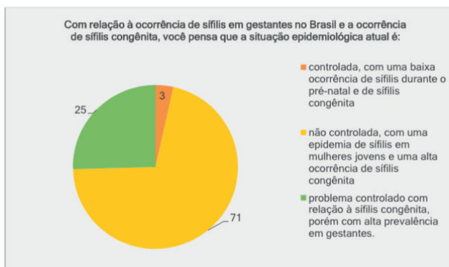
Gráfico 1 – Respostas para a situação epidemiológica da sífilis no Brasil, dados de 2017

Quanto a situação epidemiológica da sífilis no Brasil, 70,5% responderam adequadamente em 2017, afirmando que a situação não está controlada existindo uma epidemia de sífilis em mulheres jovens com alta ocorrência de sífilis congênita, porém, 25,4% dos médicos ainda acredita que a situação da sífilis congênita está controlada (Gráfico 1). Em 2017, dentre os profissionais formados até 10 anos, 80% respondeu adequadamente. No grupo dos formados a mais de 10 anos 50% respondeu de forma correta. Em 2010 a porcentagem em ambos os grupos de tempo de formação foi maior em relação as respostas inadequadas.