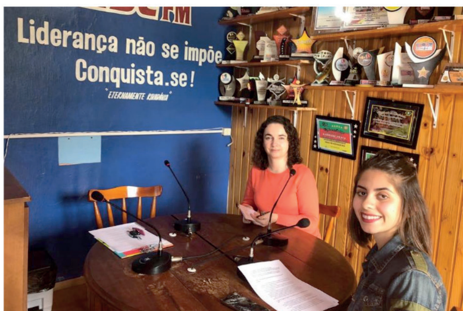
Figura 4 - Docente e discente divulgando os temas solos e resíduos de óleo de fritura

O quarto programa (Figura 4) apresentou a problemática dos resíduos de óleo de fritura e as atividades do projeto de extensão sobre solos, desenvolvido por uma docente nas escolas do município.