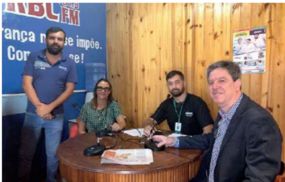
Figura 2 - Equipe diretiva e secretaria acadêmica divulgando os cursos e a forma de ingresso na Unipampa

O segundo programa (Figura 2) referiu-se aos cursos e as formas de ingresso na Unipampa. A divulgação dessa temática se faz necessária para que a população da cidade, conhecendo a universidade, desperte interesse e saiba como proceder para ingressar na acadêmica.