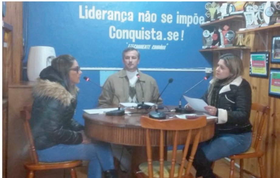
Figura 1 - Coordenadores acadêmico e administrativo expõem a estrutura física e acadêmica do campus São Gabriel