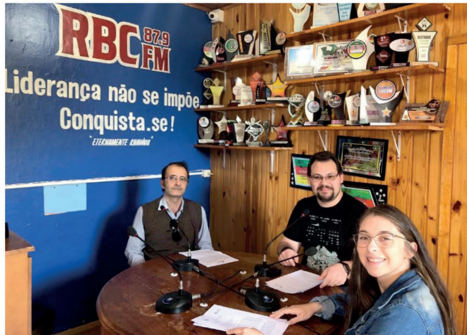
Figura 6 - Docente, técnico e discente apresentando os projetos

O sexto programa (Figura 6) apresentou à comunidade dois projetos, são eles: a) ”Música na Universidade” – que oportuniza que docentes, discente, técnicos e população em geral tenham acesso à música. O grupo idealizador do projeto se reúne semanalmente para ensino da musica e troca de experiências; b) ”Oliveira Silveira: o poeta da consciência negra” – que busca disseminar para a população gabriellense a importância do poeta para a cultura afro brasileira.