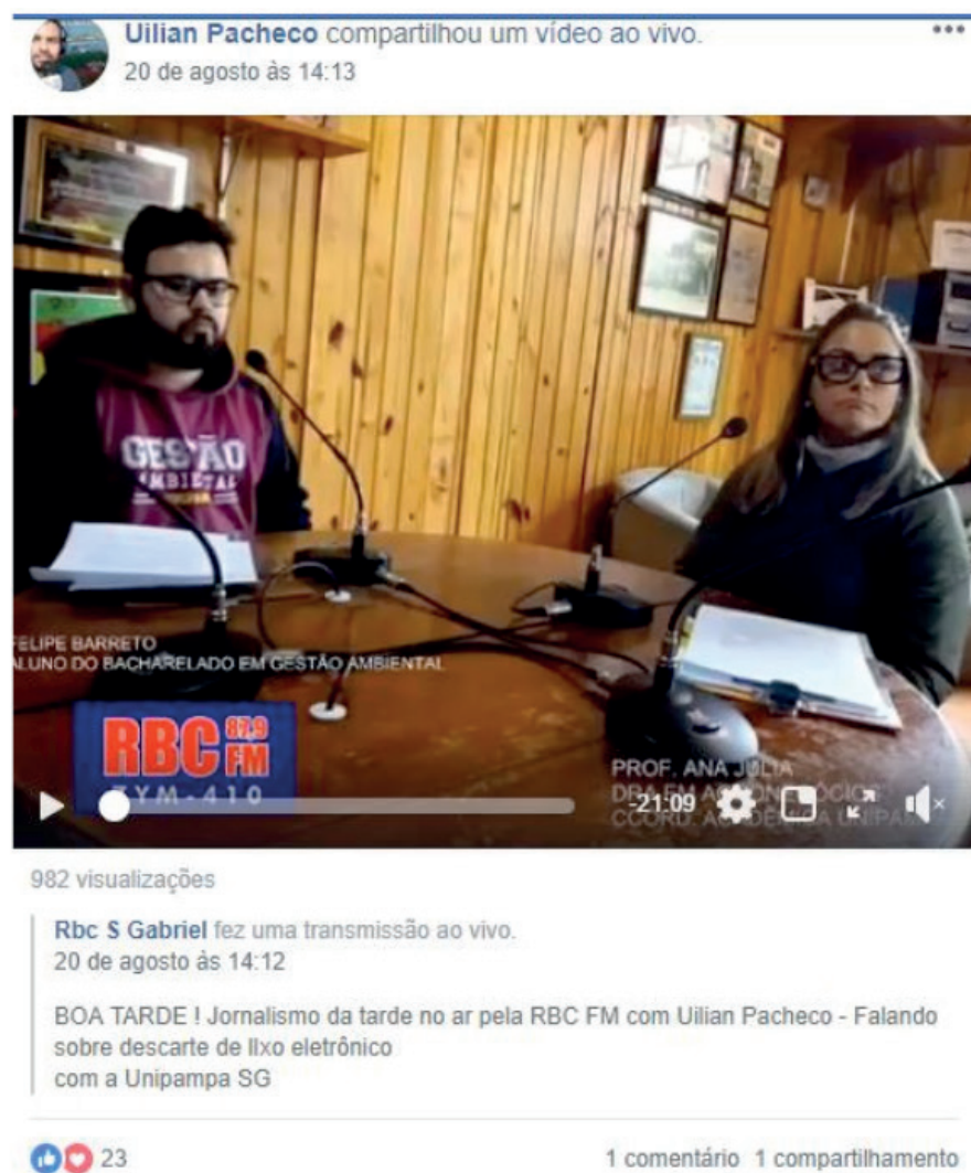
Figura 5 - Discente e docente expõem a problemática dos resíduos eletrônicos

O quinto programa (Figura 5) expôs a problemática dos resíduos eletrônicos, que constantemente causam dúvidas na população sobre como proceder para o descarte correto. O programa informou a comunidade sobre a realidade do consumo de eletrônicos no país, os impactos do descarte inadequado, bem como as maneiras corretas de o fazê-lo. Destacou-se, durante o programa, os pontos de coleta presentes no município de São Gabriel - RS.