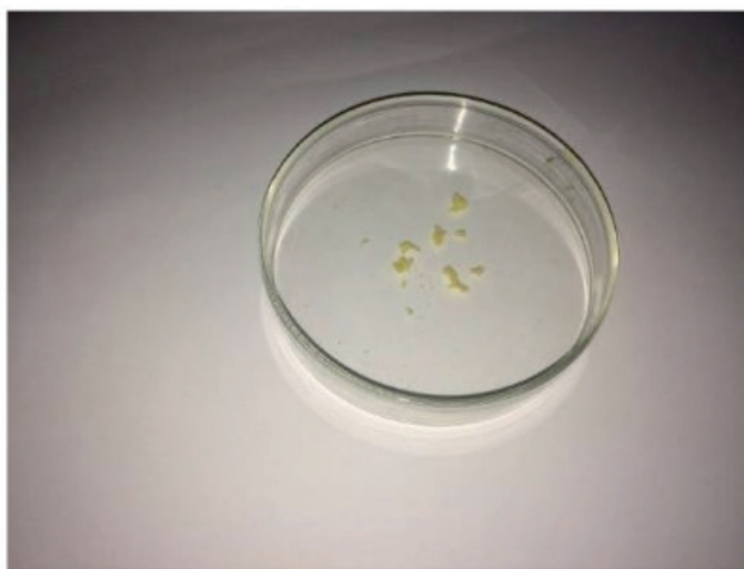
Figura 1 – Microcápsulas após o teste de estresse térmico

Quando as microcápsulas sofreram o estresse térmico resistiram, observou-se que com temperaturas elevadas, superiores a 70° C, as micropartículas apresentam perda de massa, possivelmente isso ocorre pela presença de água nas microcápsulas, ou seja indicando que quando foram levadas para secagem no Spray drying , não foram totalmente secas, logo com temperaturas elevadas ocorre a evaporação da mesma e, por conseguinte, perda de massa do material final (Figura 1).