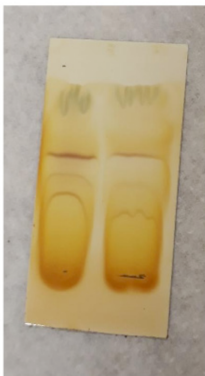
Figura 3: Técnica de CCD revelada em Iodo