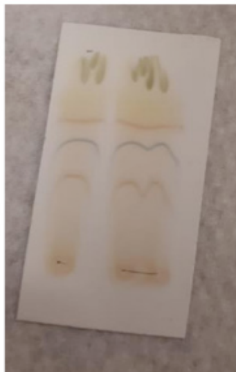
Figura 2: técnica de CCD