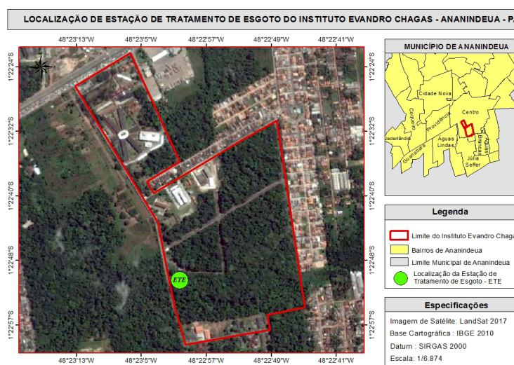
Figura 1 - Mapa de localização da ETE IEC – Ananindeua (PA).

O presente trabalho foi desenvolvido nas instalações da Estação de Tratamento de Esgoto (ETE) do Instituto Evandro Chagas (IEC), cujo fluxograma de tratamento consiste em sistema de lodos ativados de fluxo intermitente de esgoto. Esta ETE encontra-se localizada na BR 316 km 7, no município de Ananindeua-PA, pode-se observar na Figura 1. As águas residuárias geradas no IEC são provenientes das atividades laboratoriais e administrativas oriundas de pesquisas biomédicas e da prestação de serviços em saúde pública relacionadas às áreas de ciências biológicas, meio ambiente e medicina tropical.