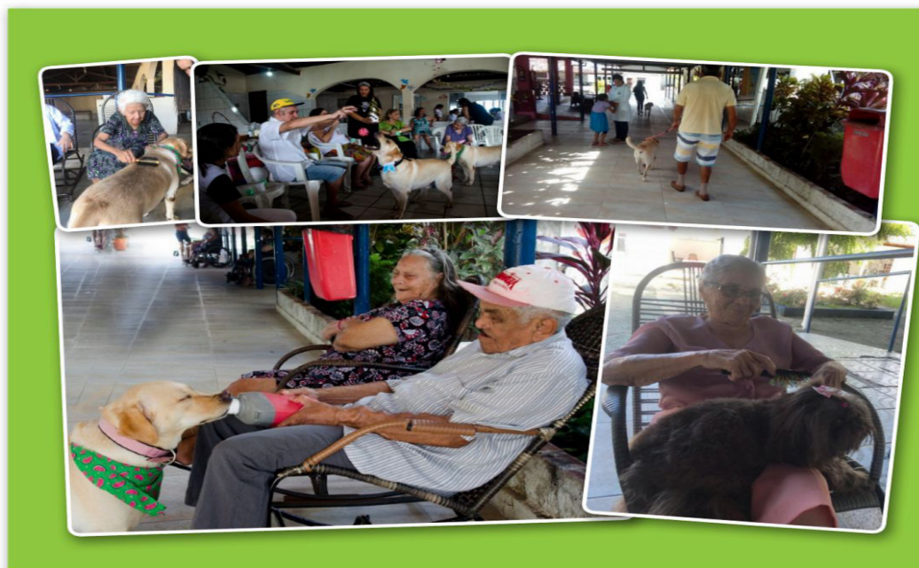
Figura 1 – Interação dos idosos com os cães de grande e pequeno porte

Desde as primeiras visitas os idosos interagem com os cães de forma positiva através de toques, colocação dos cães no colo, escovação, ofertando água e/ou petiscos, fazendo passeios no corredor da instituição com os cães nas guias entre outras atividades coletivas e individuais (Figura 1)