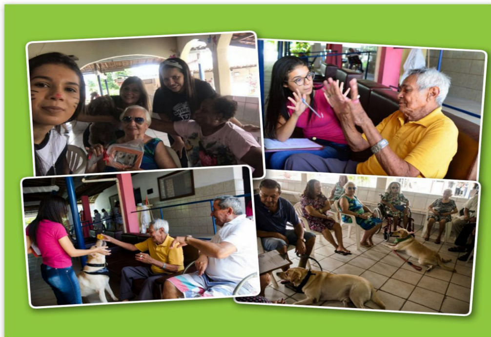
Figura 2 – Interação entre os idosos e com os alunos da equipe