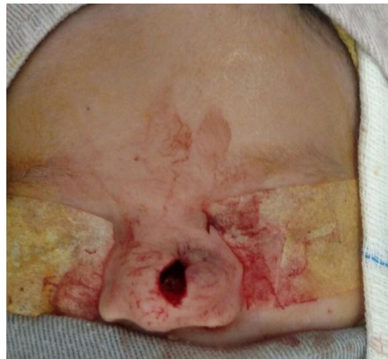
Figura 3: Ressecção da lesão em imagem perioperatória.