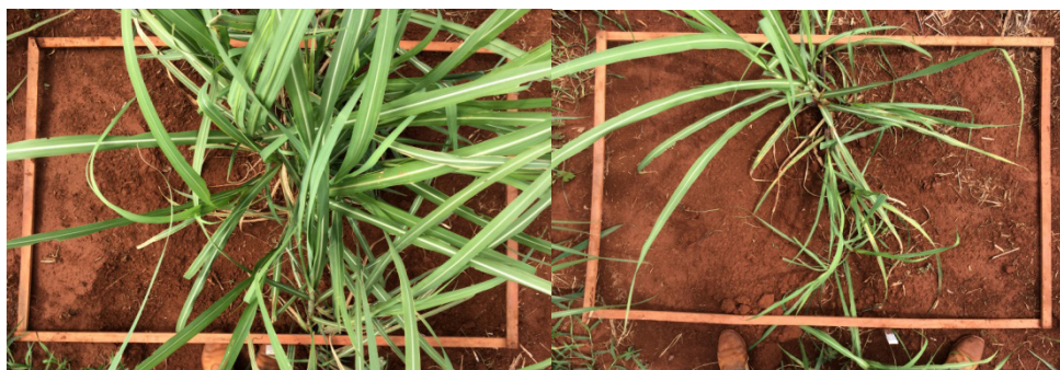
Figura 1: Fotografia do retângulo de madeira (1,5 m 2 ) posicionado no centro da linha a 1,5 m de altura.

Os resultados foram submetidos à análise de variância (ANOVA), realizada pelo teste F a 5% de probabilidade, e as médias comparadas pelo teste de Tukey e Dunnett a 0,05 de significância.