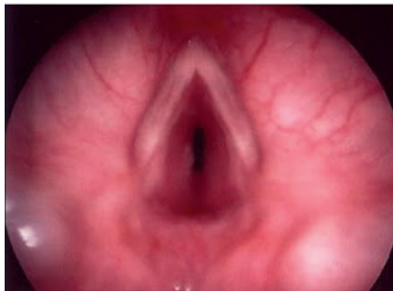
Figura 2. Imagem endoscópica de uma estenose subglótica.