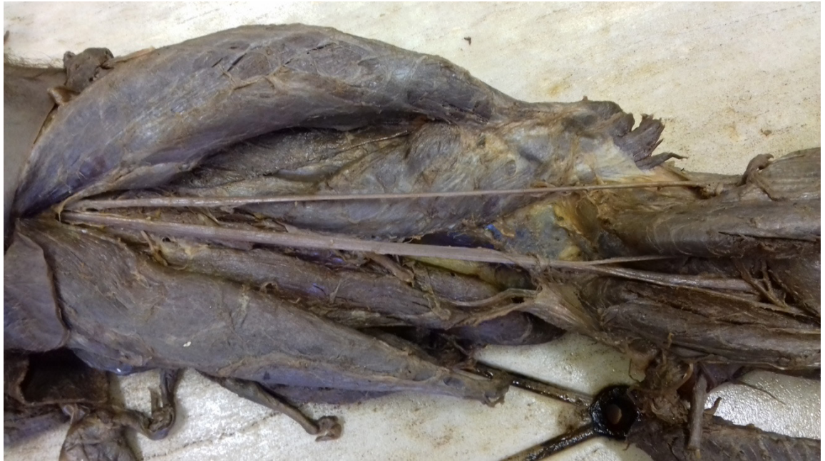
Figura 1: Divisão do nervo isquiático imediatamente inferior à região glútea.