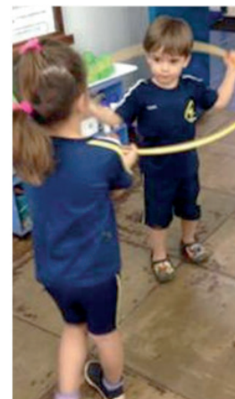
Figura 8- Apreciação e dança da música: Planta Bambolê.