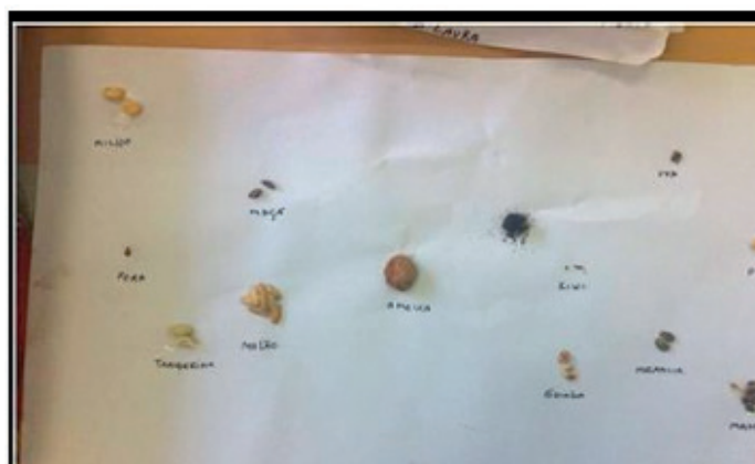
Figura 4- Investigou-se o embrião presente no interior das sementes.