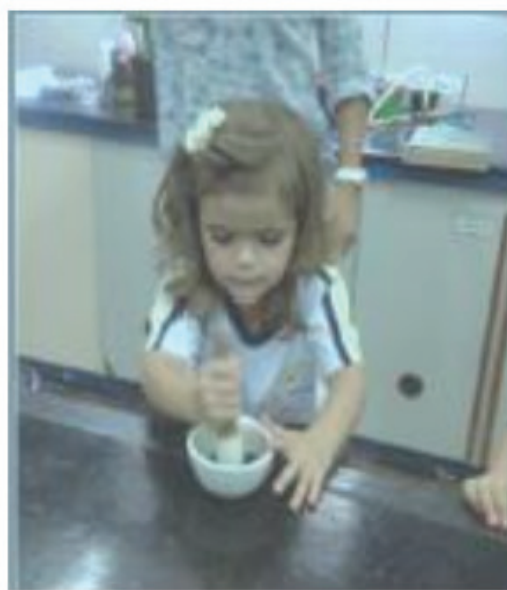
Figura 2 -produção chá e café com a utilização de sementes.