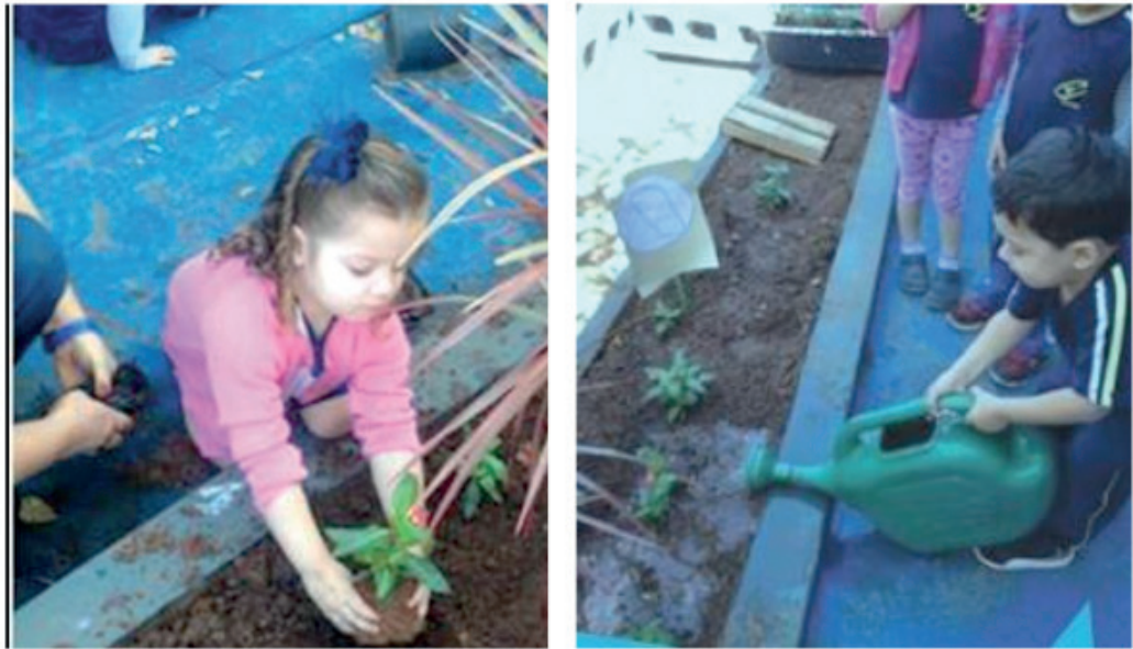
Figura 5- Plantio e cuidados para um bom desenvolvimento da planta.