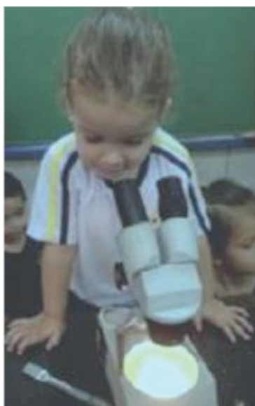
Figura 3- Investigou-se o embrião presente no interior das sementes.