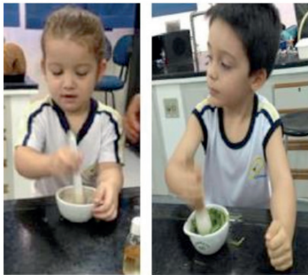
Figuras 6- produção de repelente caseiro com Citronela