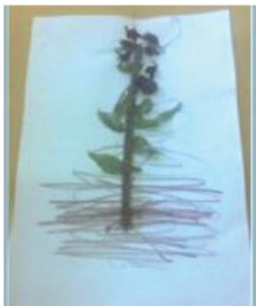
Figure 1 Produção de cartaz para o reconhecimento das partes das plantas.