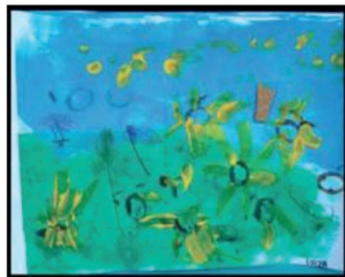
Figuras 9- Apreciação e releitura da obra “Os girassóis”, do artista rio-pretense, Jocelino Soares

O resultado completo do trabalho encontra-se editora em uma revista no link abaixo: http://coopenriopreto.com.br/arquivo/RevistaEIC2.pdf