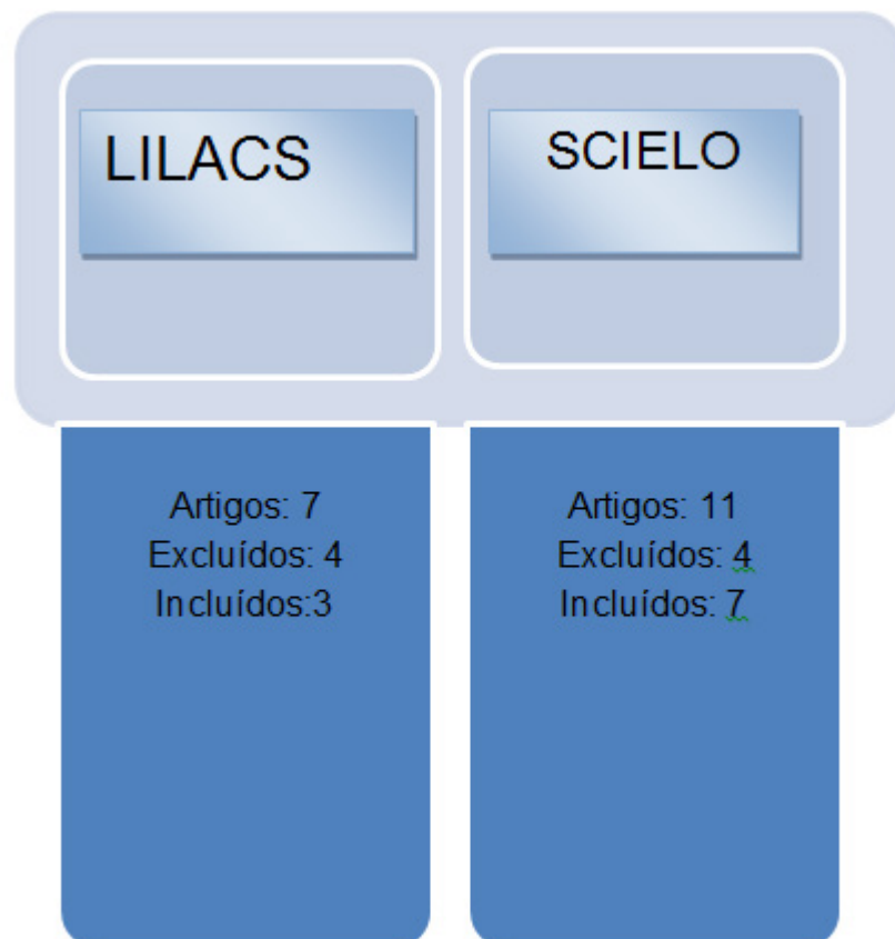
Imagem 1- Artigos Seleccionados para análise.

A seleção dos artigos se deu conforme a imagem 1.