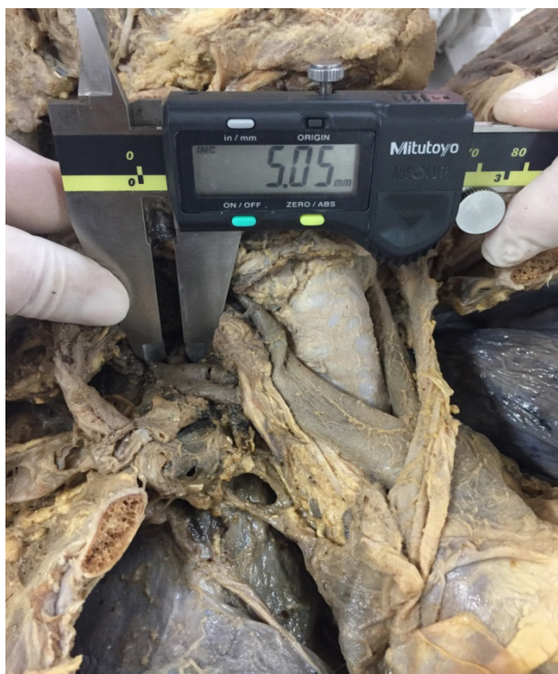
Figura 3: Medição de artéria vertebral direita.

Já a artéria vertebral direita, que se origina da artéria subclávia direita e esta provém do tronco braquiocefálico, teve uma medida de 5,05mm de diâmetro (Figura 3), também próxima ao seu sítio de eclosão. A artéria vertebral esquerda, no caso, mostrou-se 1,8 mm maior que a artéria vertebral direita.