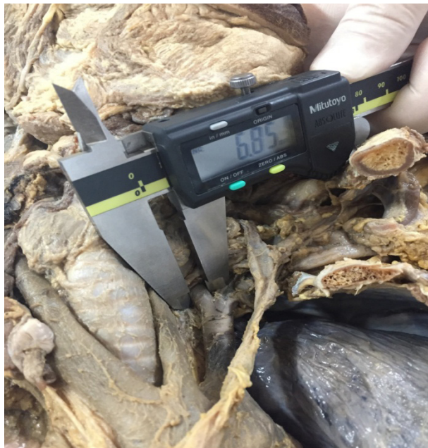
Figura 2: Medição de artéria vertebral esquerda.

Já a artéria vertebral direita, que se origina da artéria subclávia direita e esta provém do tronco braquiocefálico, teve uma medida de 5,05mm de diâmetro (Figura 3), também próxima ao seu sítio de eclosão. A artéria vertebral esquerda, no caso, mostrou-se 1,8 mm maior que a artéria vertebral direita.