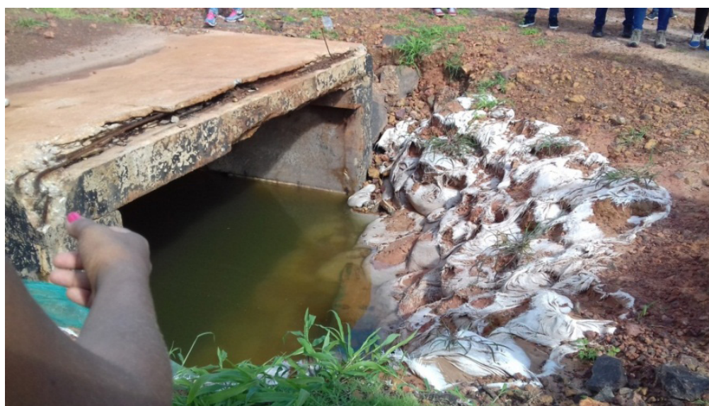
Figura 1 – Barragem feita para fechamento de comporta

A Laguna possui duas comportas, porém encontram-se desativadas por medidas governamentais (Figura 1) em análise da mesma constatou-se que não foram preservados os 30m de mata ciliar conforme o artigo 2º da lei nº 4.771/65 do Código Florestal para Área de Preservação Permanente.