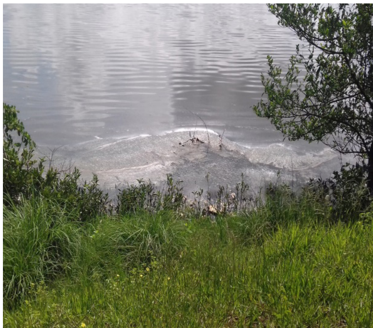
Figura 2 - Mancha verde decorrente do processo de eutrofização