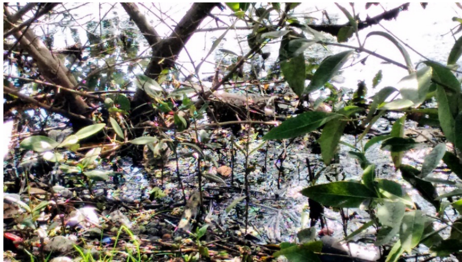
Figura 3 – Acúmulo de resíduos à margem do mangue